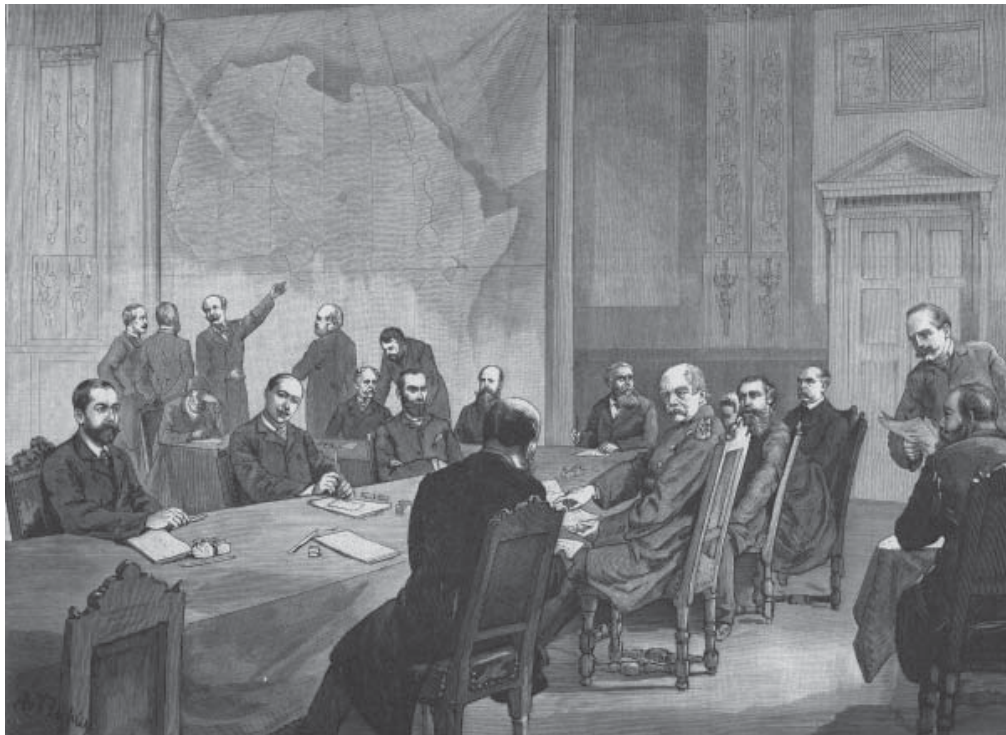
Ilustração que representa as lideranças reunidas na Conferência de Berlim.

Este processo se deu entre os anos de 1885 e 1887, a partir da Conferência de Berlim.