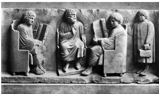
Relievo mostrando uma escola romana (aprox. 200 a.C.).