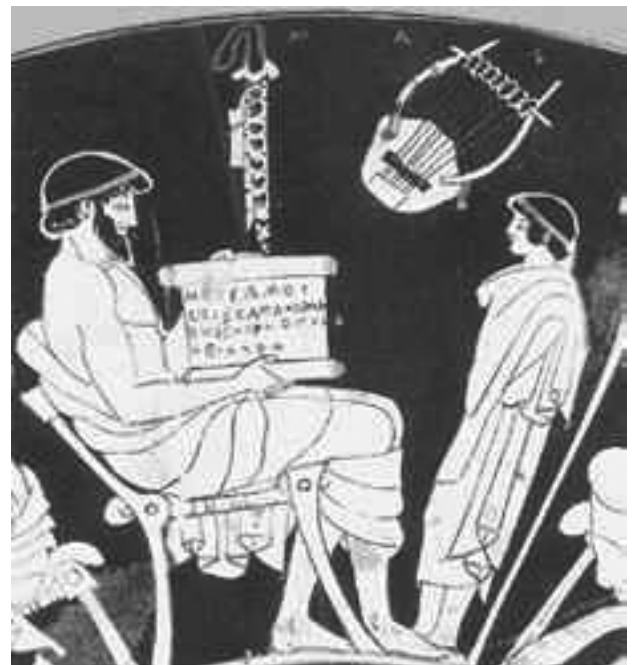
Na Grécia antiga havia professores de ginástica ( paidotribés ), de música ( kitharistés ) e, no final do século V a.C., surgiram os grammatistés , para ensinar as crianças a ler e escrever (Fonte: http://www.educ.fc.ul.pt ).