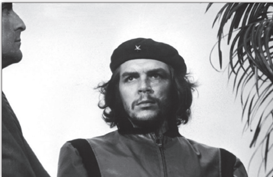
Che Guevara em Havana, 1961. Autor: Alberto Korda. ( http://pt.wikipedia.org/wiki/Ficheiro:Heroico1.jpg ).

no século XX? Durante o século XIX e até a I Guerra Mundial (1914-1918), a atuação política estava centrada nos parlamentos e monarquias, nos indivíduos que representavam regiões e grupos sociais. No século XX, a ênfase da ação política deslocou-se desses protagonistas, homens de talento e porta-vozes de valores morais e éticos específicos, para a esfera dos partidos de massas e a propagação de valores sociais universais, como a democracia, os direitos civis, as políticas públicas e a ação do Estado. A orientação e a conduta pessoal foram progressivamente buscadas em novas referências, não apenas da política, mas também das artes, do esporte, das profissões liberais ou da religião.