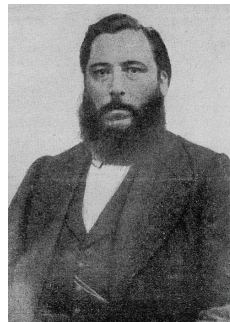
“Foto de José Hernández”. Disponible en: https://commons.wikimedia.org/wiki/ File:Jos%C3%A9_Hern%C3%A1ndez.jpg Accedida el: 28/06/2016.

Y cuando la habian pasao, una madrugada clara, le dijo Cruz que mirara las últimas poblaciones; y á Fierro dos lagrimones le rodaron por la cara. (HERNÁNDEZ, [1872] 2009, p. 86)