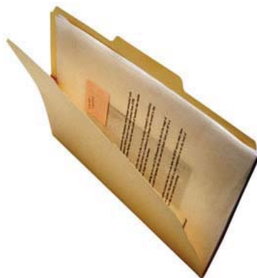
Foto de documento.

Vejamos com mais acuidade essa posição de Silva.