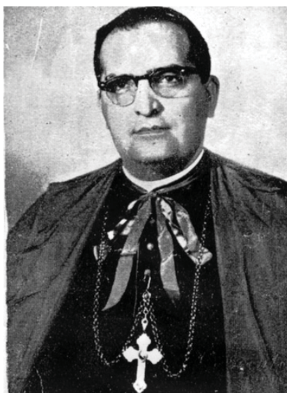
Foto Dom Fernando Gomes.

Nos anos de 1950 o curso Superior voltado para a formação de sacerdotes não mais funcionava. Mas é nessa mesma década, logo após a segunda guerra mundial, com o advento de novas mudanças políticas, que surge a ideia da criação de uma Faculdade de Filosofia. Essa iniciativa se deu na administração eclesiástica de D. Fernando Gomes, segundo bispo da diocese de Aracaju, que tinha assumido a direção da diocese de Aracaju logo após a morte de D. José Thomaz, em 30 de outubro de 1948.