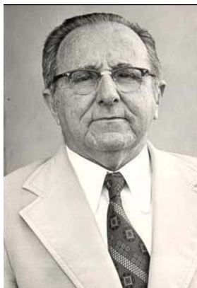
Foto de Porto.

A renovação da historiografia dos anos de 1940 com Porto.