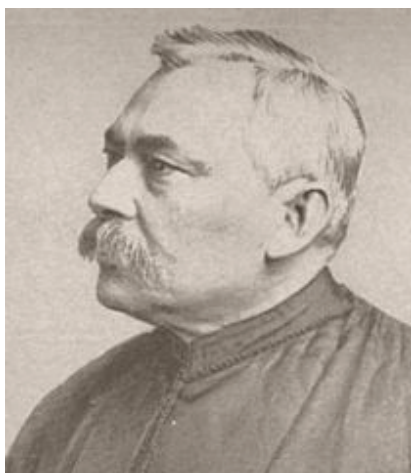
Foto de Sílvio Romero. Fonte: http://upload.wikimedia.org/wikipedia/commons/thumb/f/ff/Silvio_Romero.jpg/210px-Silvio_Romero.jpg cap. 18 de março de 2013.

JCBS diz que a discussão sobre Historiográfica Sergipana não pode começar sem apresentar o que disse Sílvio Romero em um pronunciamento que fez sobre a importância de escrever uma História de Sergipe como critérios científicos. Esse pronunciamento de Romero é denominado por José Calasans como “ Um discurso de Sílvio Romero ”.