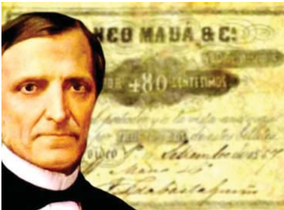
Foto do Barão de Mauá.

“Pela primeira vez na discussão do assunto foram apresentadas razões econômicas, políticas e sociais, na área provinciana como na nacional. Os fatos externos (nacionais) estariam ligados às iniciativas progressistas do período Mauá, à tranquilidade política do II Reinado, à substituição da cidade-fortaleza pela urbe-porto comercial, à marcha para a urbanização, tornando imprestáveis antigas povoações, e os exemplos da criação de novas capitais”. (SILVA, p. 19-20)