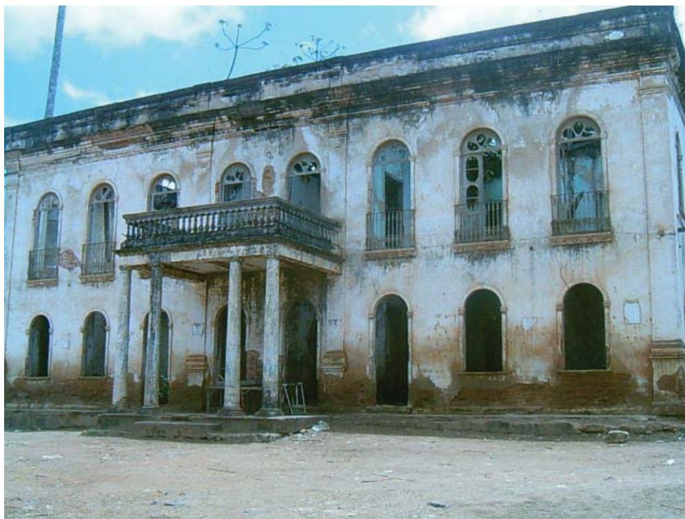
Foto do engenho Pedras- Cotinguiba.

JCBS não despreza os acontecimentos que também desenrolavam em Sergipe. No campo interno, destaca: “os aspectos geográfico e econômico predominavam, favorecendo o local Aracaju pela geografia e economicamente a Cotinguiba, maior centro produtor de açúcar da Província, que assim vencida a zona do Vaza-barris, onde ficava S. Cristóvão, de pequena produção”. (SILVA, p. 20)