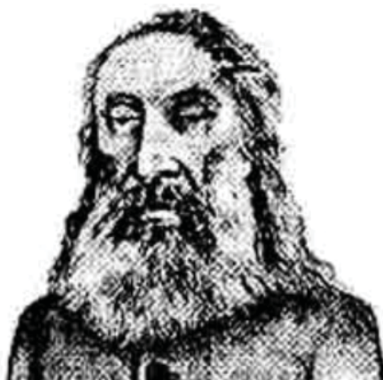
Ilustração sobre Antônio Conselheiro.

A maioria dos autores refere-se a José Calasans como um historiador que se dedicou a estudar Antônio Conselheiro e a comunidade de Canudos. Ele é merecidamente conhecido como um grande estudioso sobre esse tema.