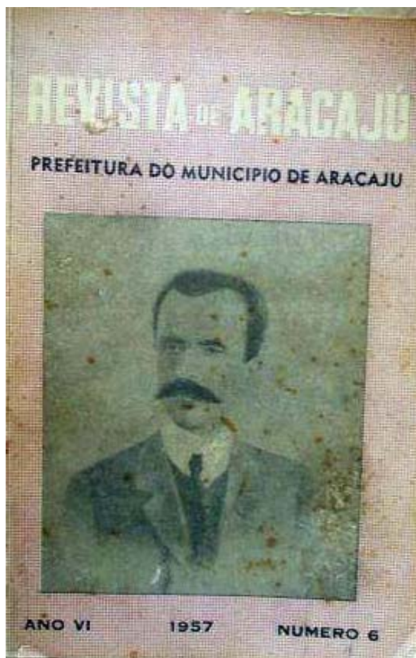
Foto da capa de um exemplar da Revista do Aracaju.

para as ciências humanas, como a geografia e a história. Como funcionário da prefeitura de Aracaju, por exemplo, nos momentos de folga, como nos referimos anteriormente, torna-se um atilado pesquisador interessado em vasculhar os arquivos (da máquina administrativa do Estado).