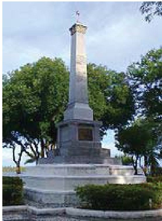
Foto do obelisco em homenagem a Inácio Barbosa.

JCBS organiza todos os seus argumentos para também reabilitar o personagem Inácio Barbosa e seu ato de 17 de março de 1855. Ele dá continuidade a historiografia do IHGSE, herdando as discussões iniciais feitas pela geração anterior.