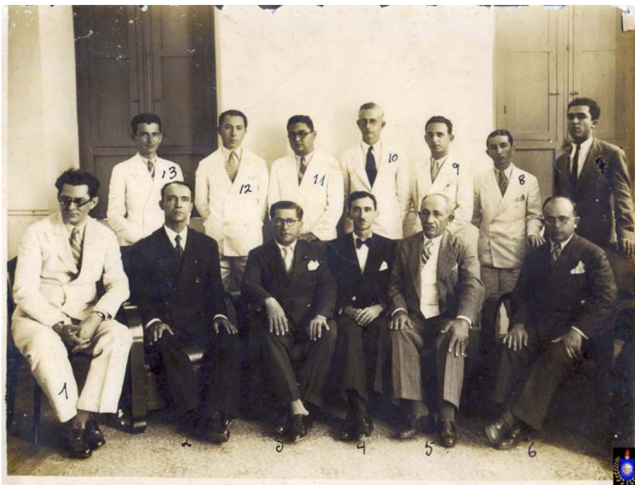
Professores do Atheneu Sergipense (s.d)

A fotografia constitui-se de uma imagem registrada com o objetivo de perpetuar uma memória. Como fonte histórica, ela tem representado importante papel no processo de reconstituição do passado, contribuindo para o conhecimento de realidades que muitas vezes não foram contempladas nos documentos mais tradicionais, a exemplo dos escritos.