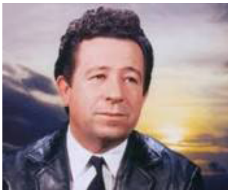
Vitor Mateus Teixeira, Teixeira (1927-1985) Cantor e compositor gaúcho, conhecido como o “Rei do disco” pelos recordes de vendas alcançadas, até nos dias atuais.

Diante do exposto e voltando no tempo, vamos analisar a música “ 24 de agosto ” de Teixeira , que faz memória à morte de Getúlio Vargas, ocorrida em 24 de agosto de 1954. Teixeira, nascido em 1927 foi compositor da genuína música popular gaúcha nascido em 1927. Indicamos essa música para ser trabalhada com uma turma de ensino médio, porém é preciso diagnosticar o perfil dos alunos, pois como a música é de um estilo bem popular, à moda de viola, precisa ser bem pensada e trabalhada. Vamos analisar a letra da canção?