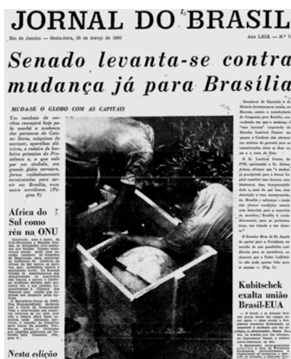
Jornal do Brasil (1960)

Partindo desse pressuposto, devemos alertar os nossos alunos sobre essas nuances, considerando que a análise dos jornais deve ser conduzida com inquérito, sempre questionando sobre o que nele é informado. A visão de mundo presente nos jornais é algo que deve ser enfatizado pelo professor, preparando os discentes para identificar os posicionamentos favoráveis ou contrários em relação ao conteúdo trabalhado.