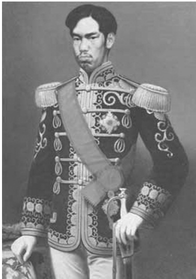
Imperador Meiji Mutsuhito

Nesta aula vamos procurar entender as principais características do capitalismo em sua fase concorrencial.