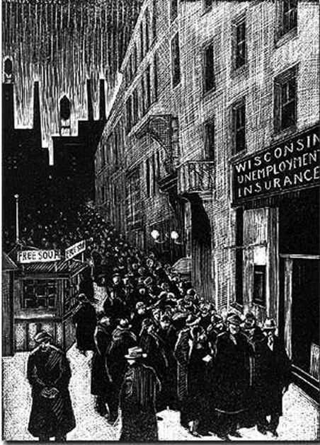
Figura 11 - Ilustração representando o desemprego.

empresas buscaram diminuir gastos com a produção e intensificaram a substituição da força de trabalho por trabalho morto (máquinas, informatização, robotização etc.). Uma das conseqüências foi a dispensa de força de trabalho, gerando um grande desemprego (voltaremos ao assunto quando do estudo do capital monopolista).