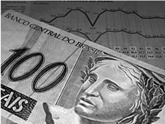
Figura 5 - Nota de Cem Reais (Fonte: http://www.imagens.google.com.br ).

As afirmações de Peliano, citadas acima, dirigem para a necessidade de se ter clareza do que seja “capital”, elemento chave do modo de produção capitalista. Por capital, geralmente, se entende como uma riqueza ou dinheiro, porém, quando usamos o termo no contexto histórico capitalista, o significado do “capital” assume, não só o significado de “riqueza acumulada”, mas também e principalmente, de riqueza que se reinveste com o objetivo de “auto-expansão”, ou seja, capital, no capitalismo, é riqueza que se aplica para a reprodução do modo de produzir e das relações sociais