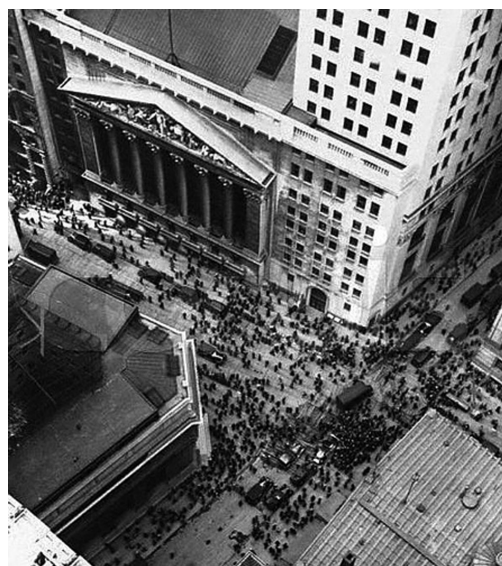
Figura 12 - Aspecto de Wall Street no início do século XX

Nesse espírito se desenvolve e se afirma o que se pode chamar de “utopia liberal”: propriedade, livre iniciativa e livre jogo do mercado devem assegurar o melhor mundo possível. Isso implica reduzir ao máximo possível tudo o que vem do Estado (BEAUD, 1981, p. 131).