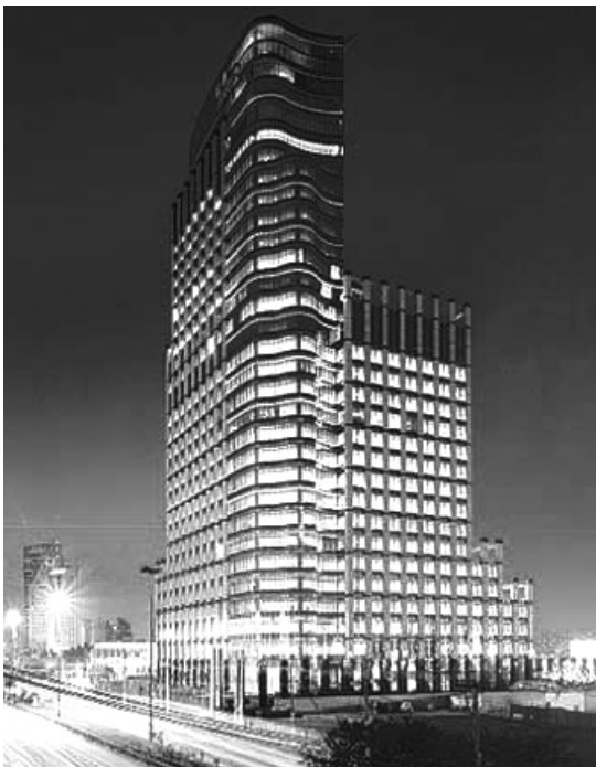
Figura 6 - Sede brasileira do Bank Boston, em São Paulo.

O outro elemento do capital produtivo é o