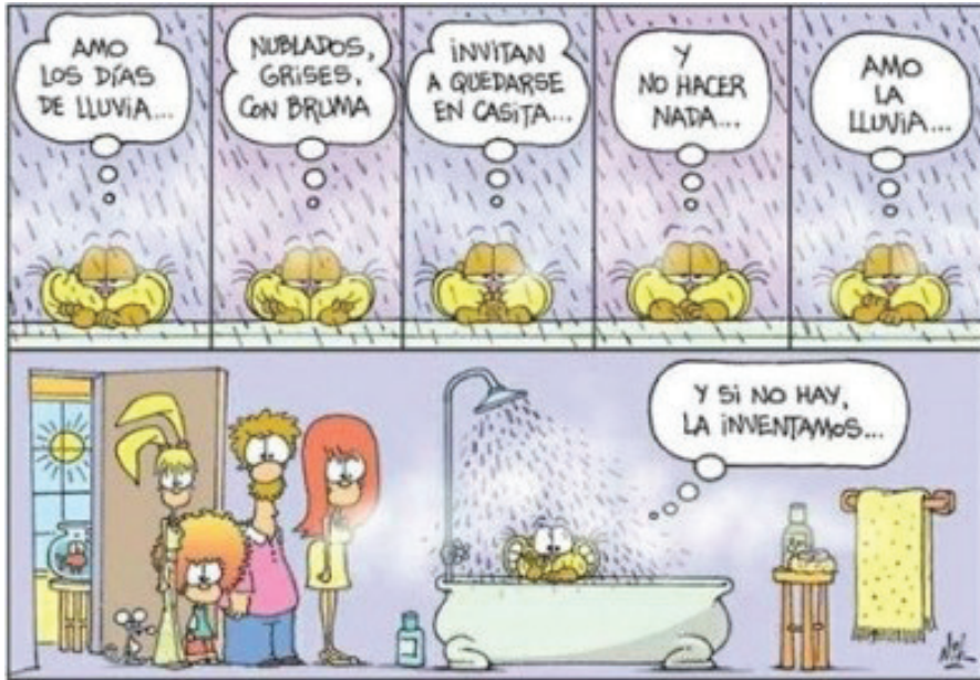
Legenda: ejemplo de dibujo colorido https://eridasouza2.files.wordpress.com/2014/06/1527071_10151854874386304_1534062218_n-e1403214487639.jpg