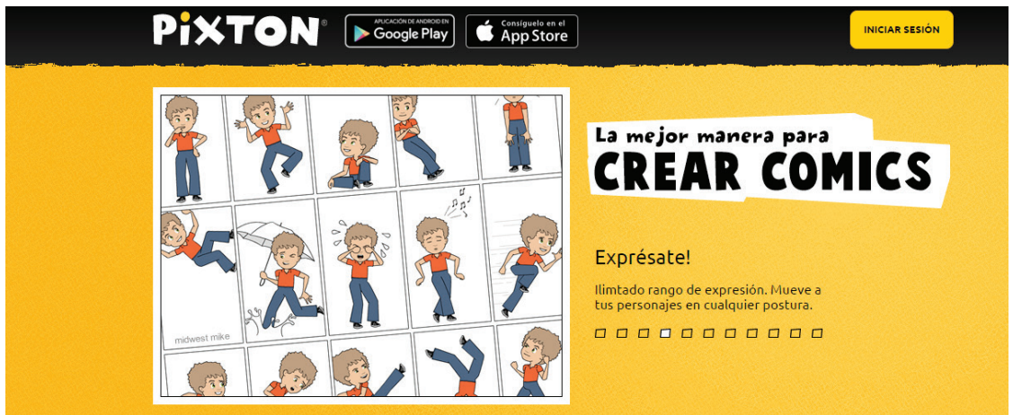
Legenda: site Pixton

Para la elaboración de la historieta digital, sugerimos el sitio Pixton , disponible en el enlace http://www.pixton.com/es/ :