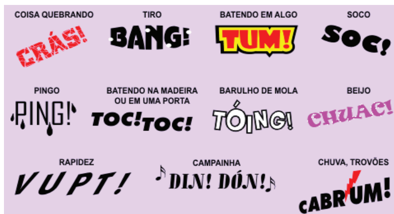
Legenda : ejemplo de onomatopeya 2 http://4.bp.blogspot.com/-WjiXQC5Bhro/UHI9k6UJPD/AAAAAAAAATQ/MxTEN5sXBqk/s1600/onomatopeia.gif