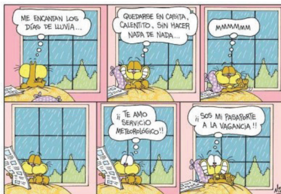
Legenda: ejemplo de dibujo

Puede representar el ambiente, acciones y personajes. De modo que estas representaciones generan imágenes eficaces para el entendimiento del mensaje. Cada viñeta es constituida de la relación de los elementos visuales con los elementos verbales.