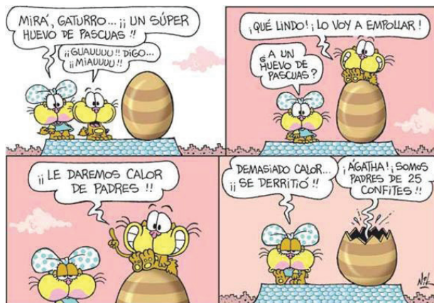
Legenda: ejemplo de recuadro https://eridasouza2.files.wordpress.com/2014/01/h4.jpg