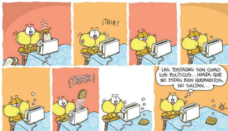
Legenda: ejemplo de onomatopeya 1 https://truquitosdemundogaturro.files.wordpress.com/2011/02/183602_10150095547771304_333723386303_6339953_158309_n.jpg