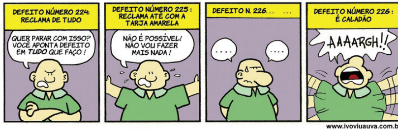
Legenda: ejemplo de recordatorio http://www.ivoiviauva.com.br/wp-content/uploads/2012/02/defeito-226.jpg