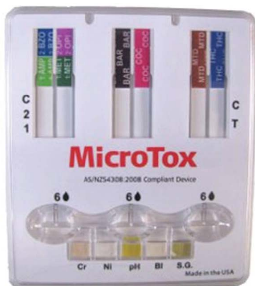
Teste Microtox.

O ensaio de toxicidade aguda/crônica com o microcrustáceo Ceriodaphnia dubia é utilizado para avaliar a ocorrência de efeitos tóxicos, agudos ou crônicos, em corpos d'água para os quais está prevista a preservação da vida aquática. O resultado do ensaio é expresso como agudo (quando ocorre