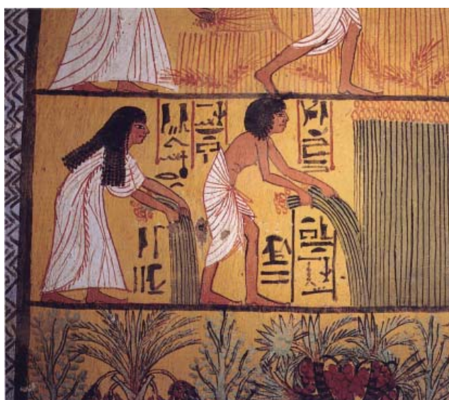
Imagem de um papiro antigo

De acordo com Kress e Van Leeuwen (1996) e Kress (2003, 2010), o texto multimodal tem seu sentido construído a partir de diferentes elementos, tais como imagens estáticas (desenhos, fotos, gráficos, tabelas), imagens em movimento (vídeos e gifs), palavras, sons, cores e etc. Mas a multimodalidade não é algo novo, ela já existe há muito tempo, sendo um exemplo os antigos textos egípcios: