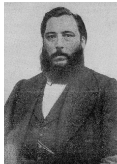
“Foto de José Hernández”. Disponible en: https://commons.wikimedia.org/wiki/ File:Jos%C3%A9_Hern%C3%A1ndez.jpg Accedida el: 28/06/2016.

Y cuando la habian pasao, una madrugada clara, le dijo Cruz que mirara las últimas poblaciones; y á Fierro dos lagrimones le rodaron por la cara. (HERNÁNDEZ, [1872] 2009, p. 86)