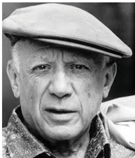
“Pablo Picasso”. Disponible en: http://www.seuhistory.com/etiquetas/pablo-picasso . Accedido el: 13/10/2015.

NOMBRE Y APELLIDOS: Pablo Diego José Francisco de Paula Juan Nepomuceno María de los Remedios Cipriano de la Santísima Trinidad Ruíz y Picasso;