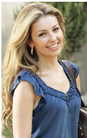
“Ariadna Thalía Sodi Miranda”. Disponible en: http://www.womenfitness.net/hottest_mexican7.htm . Accedido el: 13/10/2015.