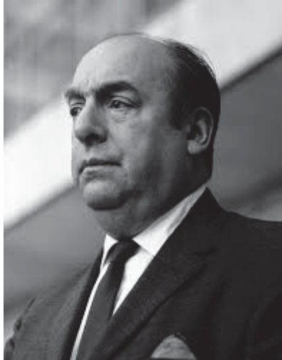
Pablo Neruda. http://www.ferrucciagianola.com

del general Pinochet. Este poema de Pablo Neruda, un poeta engajado, está dedicado a aquellos militares que terminaron con el presidente de Chile, con parte de su pueblo, con la Democracia y con los sueños de toda una nación. Sirvan estos versos de triste recordatorio y de sentido homenaje.