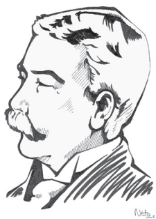
Ferdinand de Saussure

Linguista suíço (1857-1913). Sua maior contribuição foi colocar a linguística na condição de ciência. Criou as célebres dicotomias: língua e fala; significante e significado; sincronia e diacronia; sintagma e paradigma. Sua obra mais conhecida, Curso de linguística geral , é póstuma (1916) e foi escrita por seus discípulos.