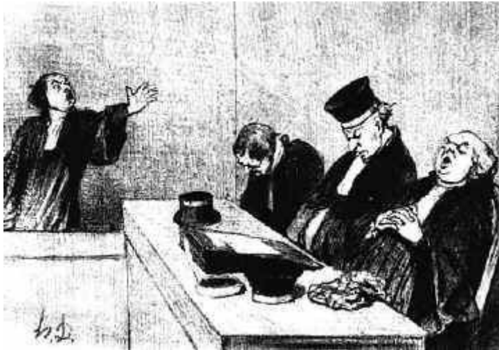
Retórica (Fonte: http://www.waltermaierovitch.globolog.com.br ).

Vem de imanentismo: diz respeito ao que é próprio do objeto. Opõe-se a transcendente.