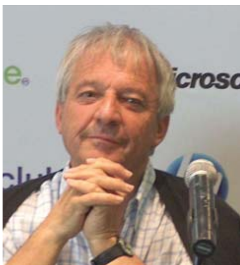
Philippe Perrenoud (1944/ ). (Fonte: www.clubepe.com ). Capturado em 31 mai. 2011

Perrenoud é também um dos autores mais citados e criticados no Brasil, já que, literalmente, assume o título de pedagogia das competências. O que significariam ensino, aprendizagem, conteúdo e avaliação no contexto das mudanças teóricas que mobilizam os educadores nos países desenvolvidos nos últimos 20 anos?