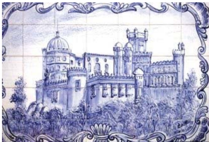
Azulejo Português, séc. XVII.

Apesar das diferentes motivações e objetivos que levaram esses dois gramáticos à elaboração de suas gramáticas, em pleno fervor do século XVI: o primeiro – Fernão de Oliveira – organiza as suas “primeiras anotações” a partir de aulas ministradas a nobres da família real portuguesa, e o segundo – João de Barros – elabora a sua gramática centrado no modelo gramatical clássico greco-latino. No entanto, uma se revela complementar a outra, tanto que parece não ser lícito avaliar o mérito de uma em relação à outra. O mais justo e acertado seria atribuir a ambas e a ambos os autores o feito histórico exemplar e irrepetível de escreverem a primeira gramática da língua portuguesa.