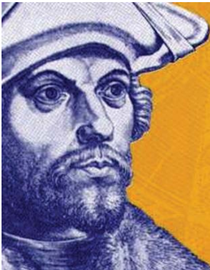
Damião de Góis.

Com efeito, trata-se de uma fase que se articula entre realidade e fantasia, aliás, situação muito comum, na época, para todas as línguas românicas , de certa forma já constituídas até então e em via de codificação. É inegável que o contexto português seja essencialmente diverso. Já em 1500, Pedro Álvares Cabral chega à terra que virá a ser a grande colônia portuguesa: o Brasil. A motivação principal do movimento de expansão territorial de Portugal era também o alargamento da rede de relações comerciais, de certo modo, com uma tradição mediterrânea já conhecida. Como as relações comerciais implicam relações culturais, estas supõem intercâmbio lingüístico.