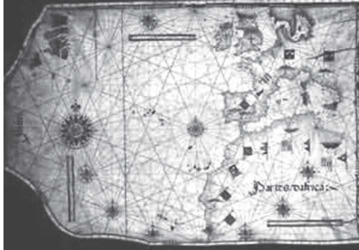
Mapa Cartográfico Português - Armando Cortesão séc. XV.

É dessa fase inicial do século XVI o significativo contingente vocabular importado de línguas asiáticas como: “jangada”, “canja”, “pijama”, “biombo”; de línguas africanas: “banana”, “girafa”, “missanga”. No Brasil, o tupi-guarani, como veremos em aula próxima, legou ao português milhares de palavras ainda hoje em pleno uso nos dois lados do Atlântico.