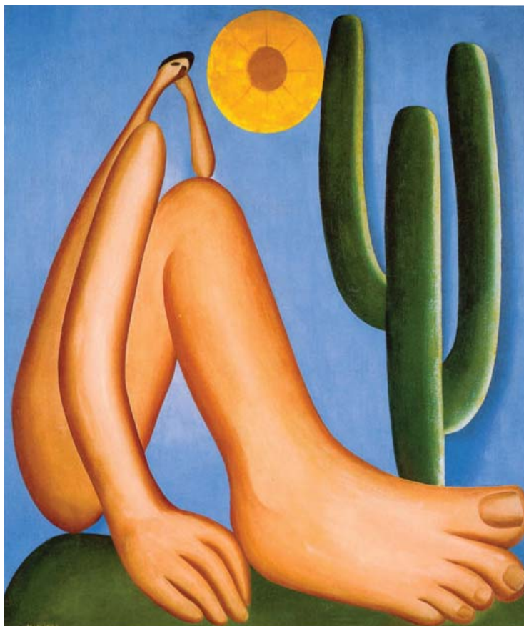
Abaporu - 1928 - Tarsila do Amaral – MALBA- Museu de arte Latino-americano de Buenos, Aires Argentina.

Um outro ponto que merece realce, nesta aula, e, evidentemente, de maior importância lingüística, é que a área lingüística mais atingida pela influência das línguas africanas, bem ao contrário do que ocorreu com o influxo tupi, não se limitou ao vocabulário, mas se estendeu densamente pelo campo da fonética e da morfologia do português.