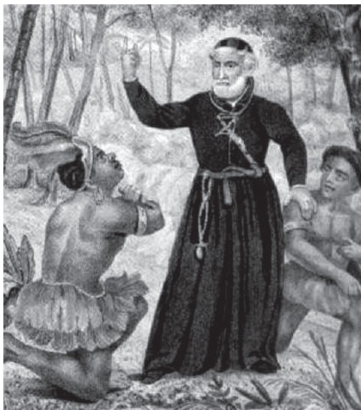
Padre Antônio Vieira pregando aos índios - séc. XVII.

Numa rápida comparação entre o soneto de Gregório e Matos e o fragmento do sermão de Vieira, podemos constatar o jogo de figuras de linguagem presentes em ambos os textos, aliado a intenção geral de aristocratizar a linguagem com torneios frasais, repetições e ornamentos do estilo que tornam a mensagem de captação difícil para o leitor comum.