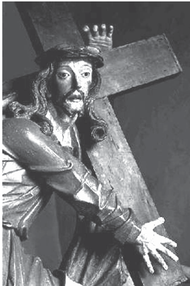
O Cristo carregando a cruz - Aleijadinho - Santuário de Bom Jesus de Matosinho - Congonhas/MG. (Fonte: http://www.colegiosaofrancisco.com.br ).

No Brasil, as expressões maiores desse influxo lingüístico se acham nos versos de Gregório de Matos, como vimos acima, e na prosa (sermões) do Padre Antônio Vieira de que o fragmento abaixo, extraído do Sermão do Mandato, é um testemunho ímpar: