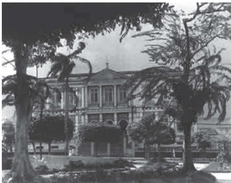
Colégio D. PedroII, no Rio de Janeiro.

Para conceder uma forma didática a esta aula, vamos limitar-nos a dois marcos históricos significativos para a questão lingüística e seus desdobramentos na educação pública da primeira metade do século XIX, inclusive condicionando debates e reações que se estendem por todo o século em referência. Esses dois marcos são: a criação do Colégio D. Pedro II , em 1837, e a eclosão do movimento romântico no Brasil, em 1836, portando idéias renovadoras, do ponto de vista sócio-cultural e lingüístico.