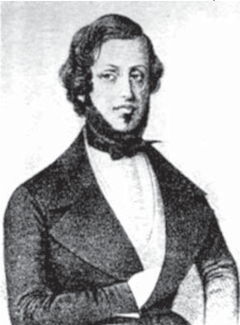
Almeida Garrett.

A questão polêmica da língua brasileira não representou um projeto lingüístico nacional e institucional que afetasse os rumos do ensino de língua portuguesa nas escolas oficiais, a partir da década de 1840. Com a criação do Colégio D. Pedro II, em 1837, todo ensino de língua nacional foi montado e rigorosamente assentido e seguido conforme o padrão lingüístico português, apesar de todo um movimento separatista que defendia a existência da língua brasileira.