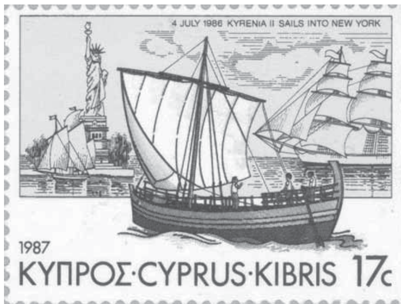
Selo Grego.

Herodiano, filho de Apolônio. Sua contribuição diz respeito à acentuação e pontuação do grego.