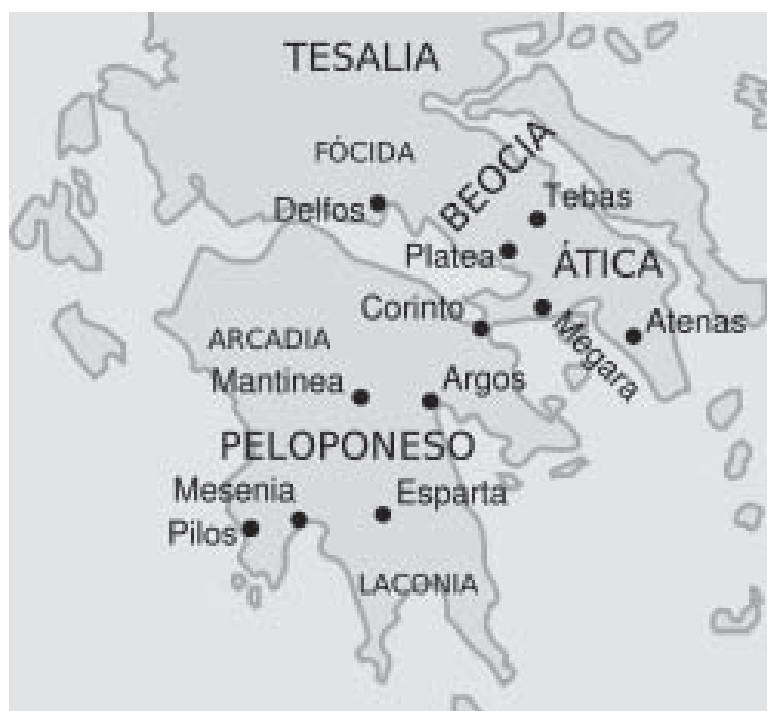
Mapa da Grécia Antiga.

Que tal acompanhar-me em uma caminhada pela Grécia!