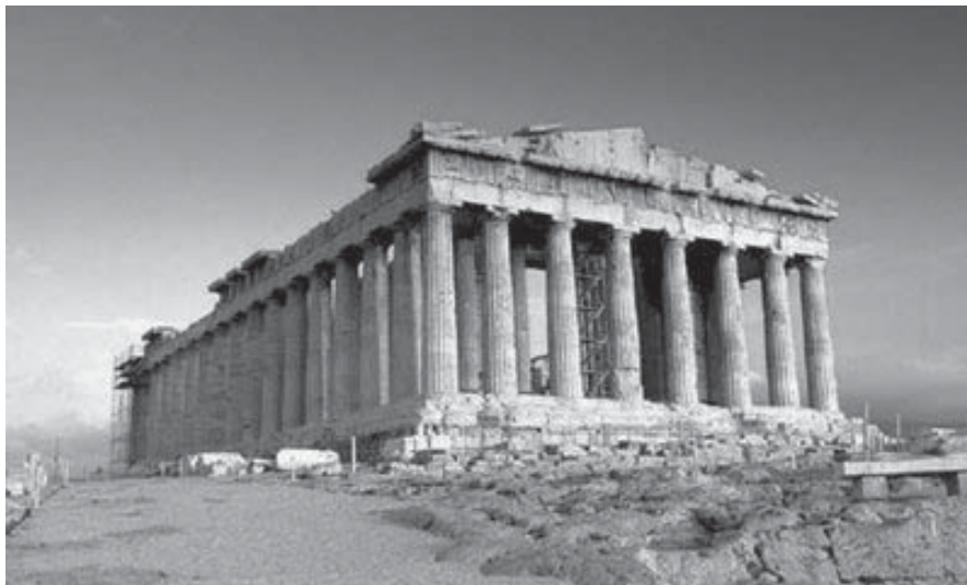
Pathernon (Fonte: http://europafacildicas.blogspot.com ).

Ler um pouco sobre a história da Grécia.