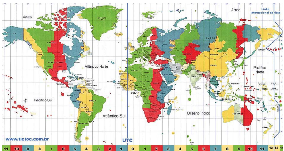
“Fusos horarios”. Disponible en: http://www.apolo11.com/tictoc/fuso_horario_mundial.php . Accedido el: 13/10/2015.

Actividad 6 – La hora no es la misma en todo el mundo. Mira la imagen abajo y explica.