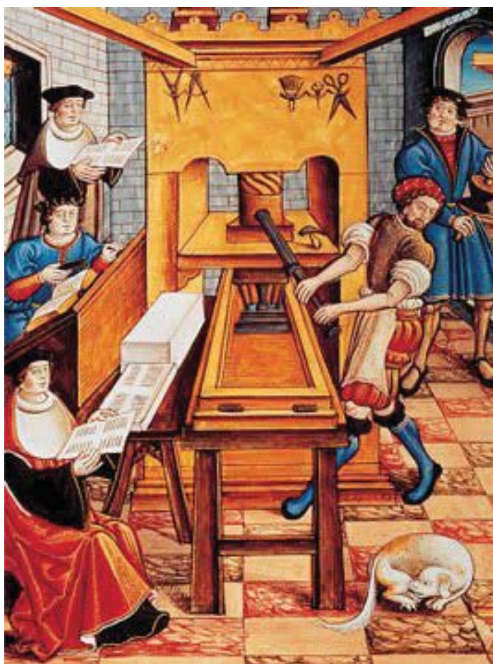
Imprenta alemana del renacimiento