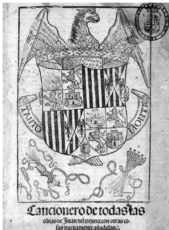
Portada del Cançionero de todas las obras de Juan del Enzina.

Otro autor importante de entonces es Fernando de Rojas, quien obtuvo un éxito fulminante con La Celestina . Ésta se publicó por primera vez en 1499 como la Comedia de Calisto y Melibea . En 1502 apareció la segunda versión ampliada de la obra que pasaba de constar de 16 a 21 actos y se titulaba Tragicomedia de Calisto y Melibea .