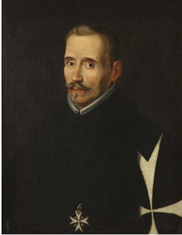
Lope Félix de Vega y Carpio, Eugenio Cajés (Fuente: http://www.wikiwand.com ).

Escritor español, Lope de Vega procedía de una familia humilde y su vida fue sumamente agitada y llena de lances amorosos. Estudió en los jesuitas de Madrid (1574) y cursó estudios universitarios en Alcalá (1576), aunque no consiguió el grado de bachiller.