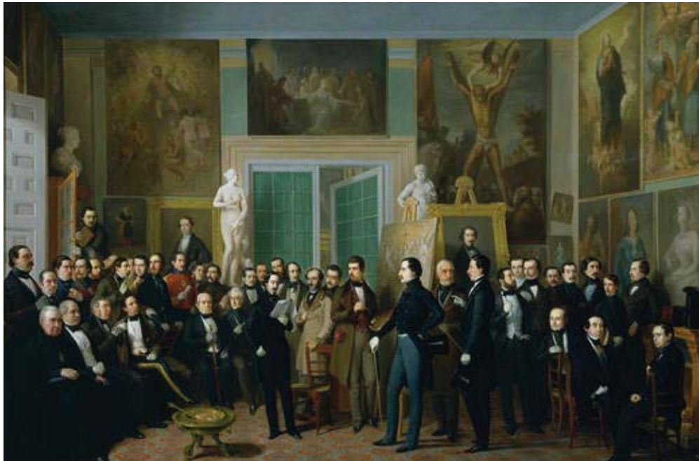
Los poetas contemporáneos, de Antonio María Esquivel.

Una vez pasada esta etapa, podemos afirmar que en torno a 1845 ha pasado ya la revolución romántica: Larra ha muerto en 1837, Espronceda en 1842, y los supervivientes evolucionan hacia el Realismo, pues el Romanticismo se hunde en un esteticismo marginal y deja de ser una actitud, un estilo de vida.