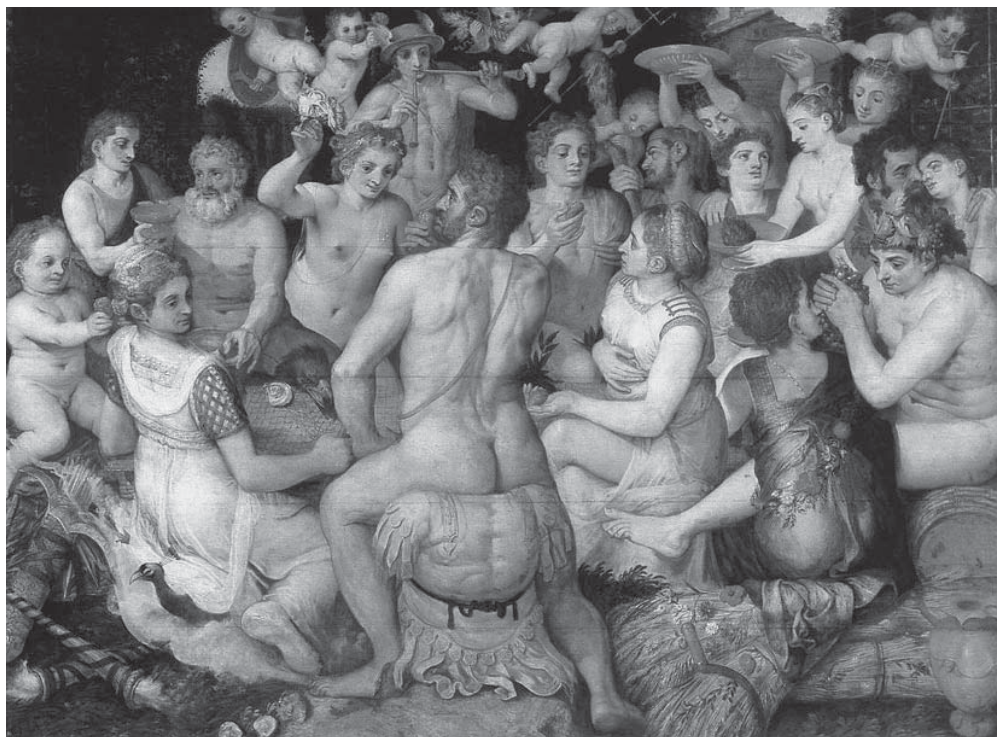
Banquete dos Deuses, Frans Floris, 1550.

Por serem manifestações de uma tradição, e não produto da criatividade individual, a maioria dos poemas narrativos compostos oralmente não é associada a nomes de poetas individuais, como é o caso do Beowulf. Segundo Chartier (2002, p. 20-21), o processo de atribuição de autoria a certas composições originalmente orais relaciona-se com a transformação da palavra inspirada, que era, a um só tempo, poética, ritual e singular, como as odes – discursos espirituais executados durante os banquetes de embriaguez dionisíaca, em “literatura”, ou em “gênero literário”, durante os festivais e competições associados aos cultos das cidades-estados ou dos santuários pan-helênicos.