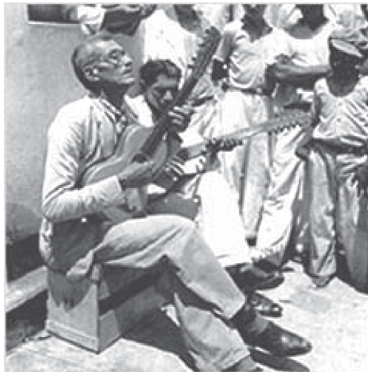
Repentista em Cajazeiras, Paraíba, 1938.

Assim, serão definidos alguns elementos característicos das composições narrativas orais, visando a sua identificação em suas versões escritas. Em seguida, veremos o papel desempenhado pela tradição e o modo como a noção moderna de autoria pode impedir a compreensão não apenas de poemas épicos antigos compostos oralmente, mas também dos cantadores e repentistas que fazem uso de tal habilidade ainda nos dias de hoje.