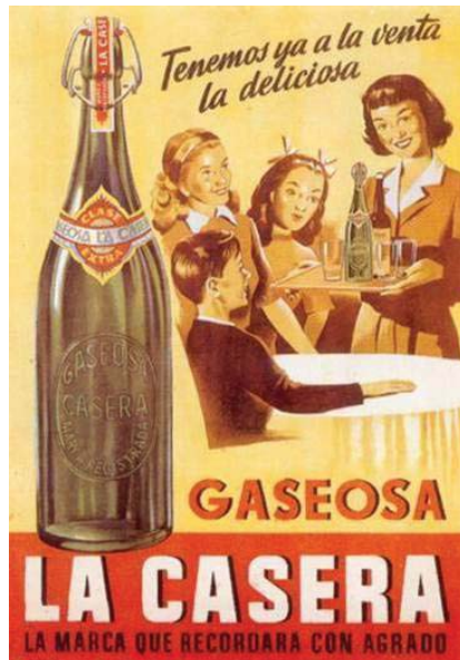
Gaseosa La Casera