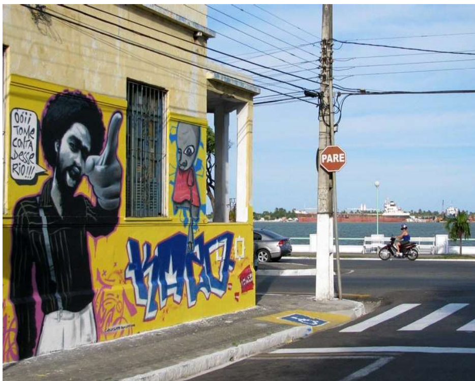
Grafite nas ruas de Aracaju

As interpretações e os objetivos dessas formas de linguagem vão despontar em práticas sociais. Os processamentos, os registros de uma instituição, as transformações em outras formas de comunicação vão moldando as práticas sociais e organizando os níveis de leitura, divulgação e institucionalização dos discursos que podem ser modificados, repetidos, transformados, a depender de quem os leia, escreva, reescreva, fale, ouça, veja, recrie.