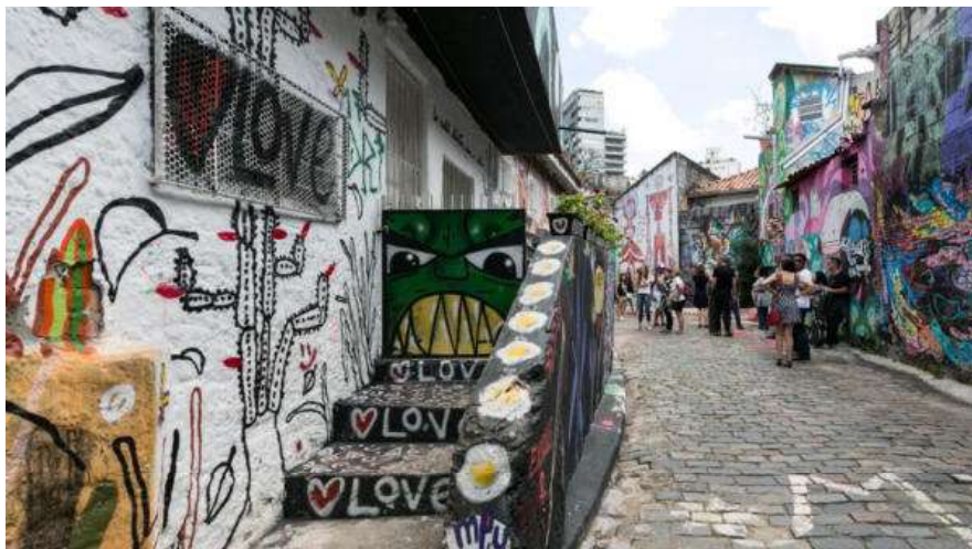
Beco do Batman – São Paulo