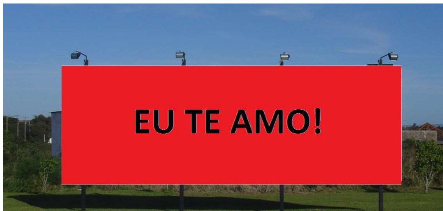
Inscrição “Eu te amo” em um outdoor