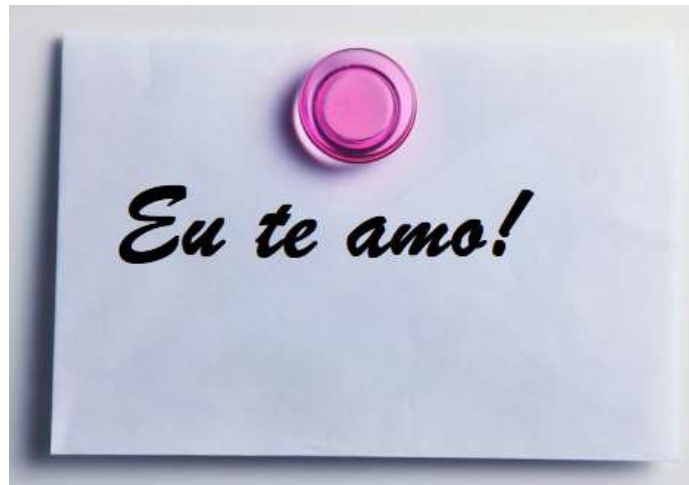
Inscrição “Eu te amo” em um pedaço de papel

Muitas vezes, o conteúdo de um texto não muda, mas “o gênero é sempre identificado na relação com o suporte.” (MARCUSCHI, 2008, p. 174). Assim, um “Eu te amo” escrito em um pedaço de papel na porta da geladeira, pode ser um bilhete; se for exposto em um outdoor, pode fazer parte de um anúncio publicitário, e se estiver gravado no corpo humano, pode ser uma tatuagem.