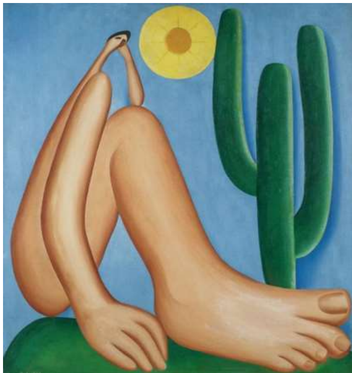
Abaporu (1928), de Tarsila do Amaral

São exemplos de paráfrase em textos não verbais as figuras 04 e 05 que seguem. No texto 04, é possível ver a retomada da ideia proposta no quadro da pintora Tarsila do Amaral (figura 03), mas também é possível perceber a construção de novos significados, pois é sempre uma nova posição. Já na figura 05, temos uma retomada do quadro original com uma crítica social construída a partir dele, como podemos observar: