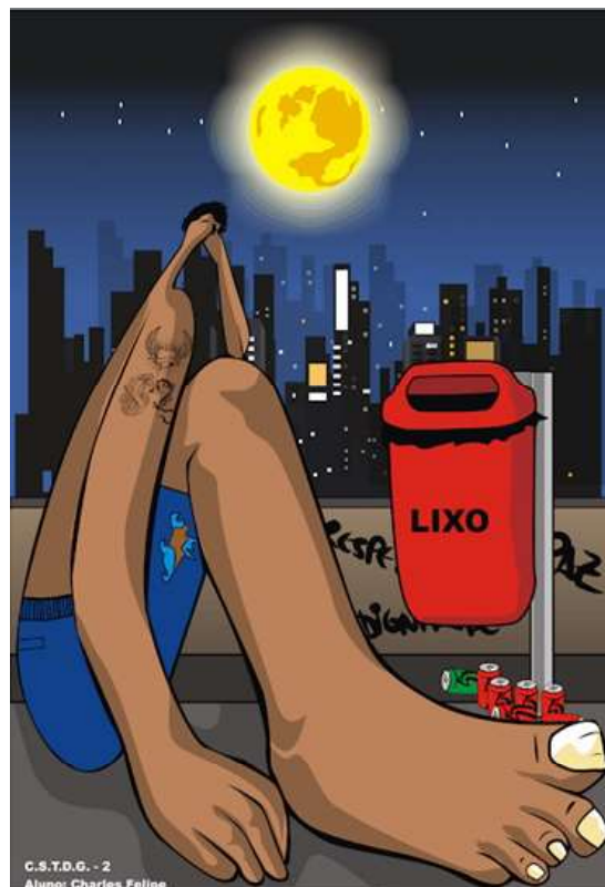
C.S.T.D.C. - 2 Aluno: Charles Felipe