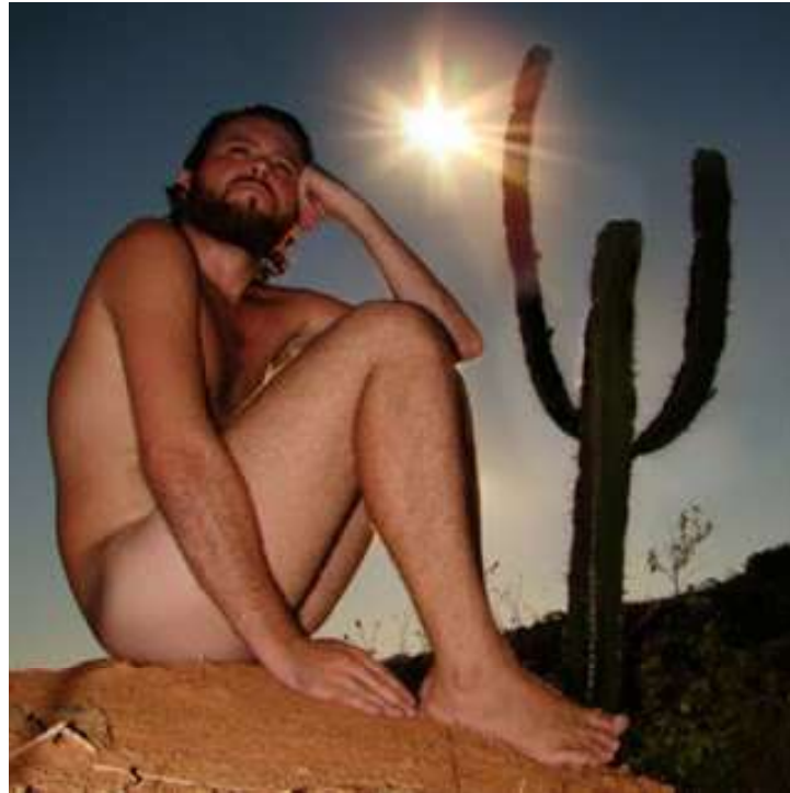
Fotografia de Alexandre Mury

Fonte: http://arteseanp.blogspot.com/2012/06/alexandre-mury.html