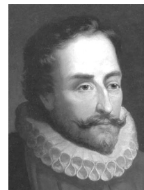
Miguel de Cervantes

Um automóvel de corrida é mais belo que a Vitória de Samotrácia.