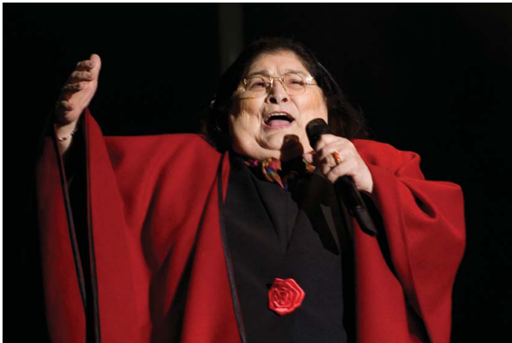
Mercedes Sosa en 2008, en Heredia (Costa Rica), en uno de sus últimos conciertos, con su tradicional poncho rojo, característico del noroeste argentino.

Haydée Mercedes Sosa, conocida como Mercedes Sosa nació en San Miguel de Tucumán, Argentina, el 9 de julio de 1935 y se puso conocida como La Negra Sosa o La Voz de América, fue una cantante de música folclórica argentina reconocida en América Latina y Europa. Mercedes Sosa comenzó a cantar en una época, en la que el tango de Buenos Aires, que era la música popular por excelencia, estaba siendo alcanzado en popularidad por la música de raíz folklórica, característica de las provincias, en un fenómeno que es conocido como el boom del folklore, producido de la mano de la industrialización del país y la migración de millones de personas del campo a las ciudades y de las provincias hacia Buenos Aires.