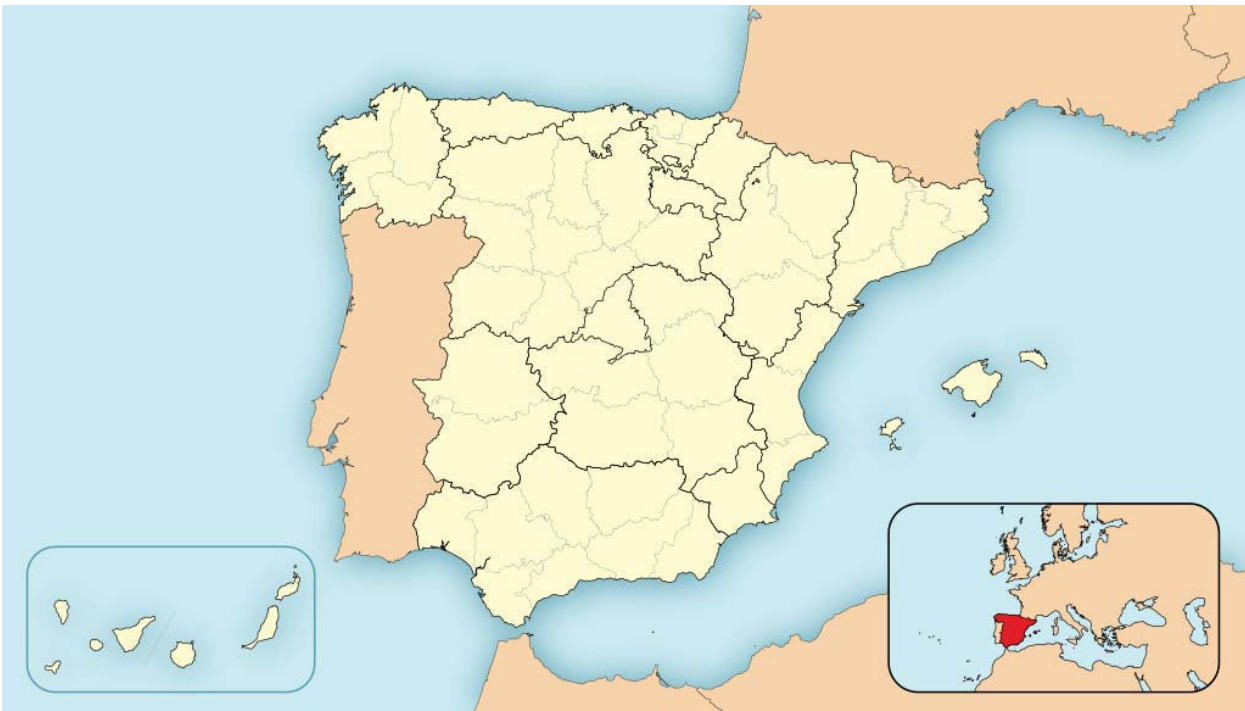
Balneario de las Islas Baleares.