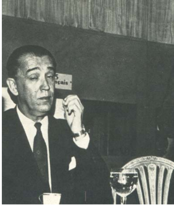
Juscelino Kubitschek (Fonte: Nosso Século. São Paulo: Abril Cultural, vol.4).