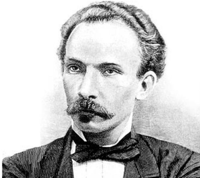
“José Martí”. Disponible en: http://www.biografiasyvidas.com/biografia/m/marti.htm . Accedido el: 01/07/2016.

La yuxtaposición de imágenes opuestas, pero que se complementan desde la pluma del poeta, es otro de los rasgos que Martí brindará al Modernismo. Simplicidad y fuerza, plasticidad al verso.