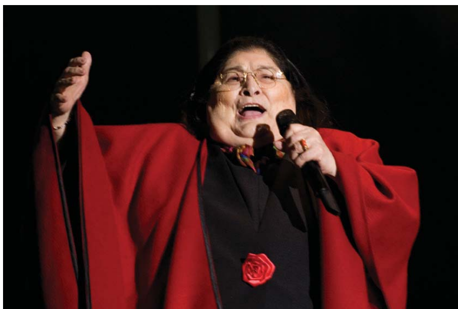
Mercedes Sosa en 2008, en Heredia (Costa Rica), en uno de sus últimos conciertos, con su tradicional poncho rojo, característico del noroeste argentino.

Haydée Mercedes Sosa, conocida como Mercedes Sosa nació en San Miguel de Tucumán, Argentina, el 9 de julio de 1935 y se puso conocida como La Negra Sosa o La Voz de América, fue una cantante de música folclórica argentina reconocida en América Latina y Europa. Mercedes Sosa comenzó a cantar en una época, en la que el tango de Buenos Aires, que era la música popular por excelencia, estaba siendo alcanzado en popularidad por la música de raíz folklórica, característica de las provincias, en un fenómeno que es conocido como el boom del folklore, producido de la mano de la industrialización del país y la migración de millones de personas del campo a las ciudades y de las provincias hacia Buenos Aires.