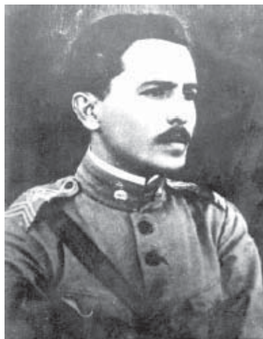
Luís Carlos Prestes como oficial do exército.