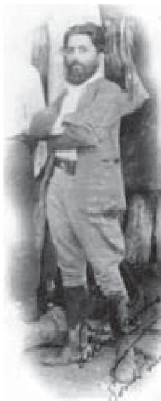
Luís Carlos Prestes por ocasião do exílio da Coluna, 1928. Porto Suarez (Bolívia).

Mas antes de ir avante na leitura desta aula, é fundamental que você assista ao filme Avante Camaradas , para associar as questões apresentadas nesse filme aos nossos comentários sobre a Coluna Prestes.