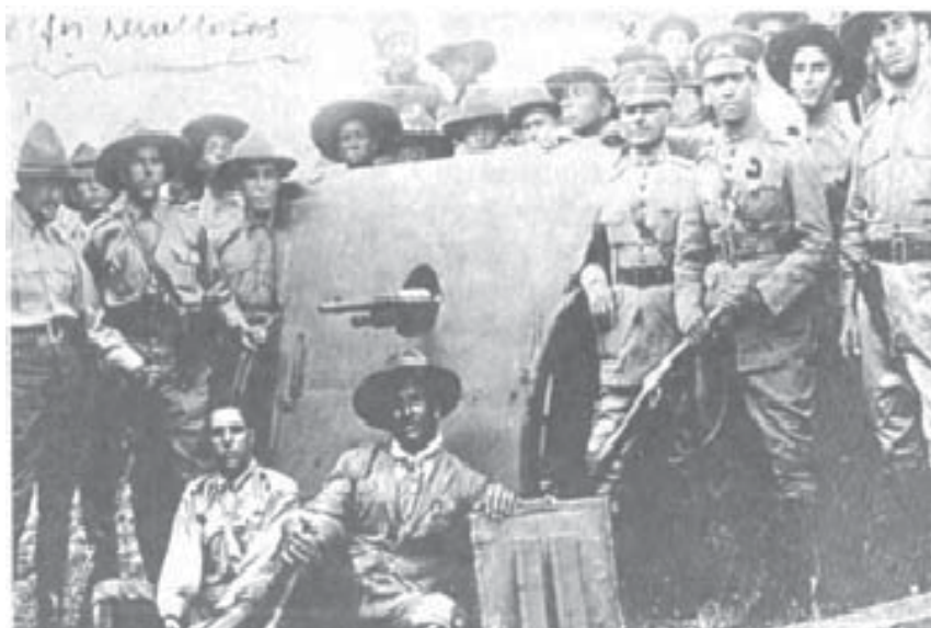
Participação dos Tenentistas na revolução de 1924.

minoria dos oficiais rebeldes que resolveu seguir na luta revolucionária, já que a maioria preferiu o exílio. A explicação militarista defendida pelo autor encontra respaldo na argumentação de que a importância ou não da adesão popular ou civil não fora cogitada para o avanço da luta revolucionária, e que a cisão de abril de 1925 ocorreu pela divergência militar em torno da guerra de movimento.