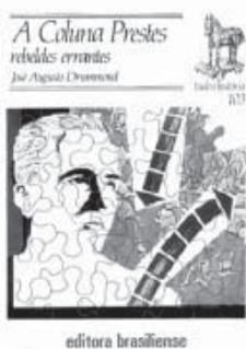
Capa do livro A Coluna Prestes - rebeldes errantes .

O sucesso da Coluna nestes enfrentamentos deve ser atribuído ao bem montado esquema de segurança. Para isso, as “potreadas” - pequenas patrulhas de cinco a quinze homens - foram fundamentais para a guerra de movimento, embora causassem baixas na tropa, pois os “potreadores”, além de trocar os animais estropiados e trazerem consigo alimentos, funcionavam como exploradores. Como re recorda Prestes, eles também traziam “vaqueanos”, que forneciam informações preciosas sobre a área, pois os mapas do Brasil, em geral, eram muito falhos nos detalhes.