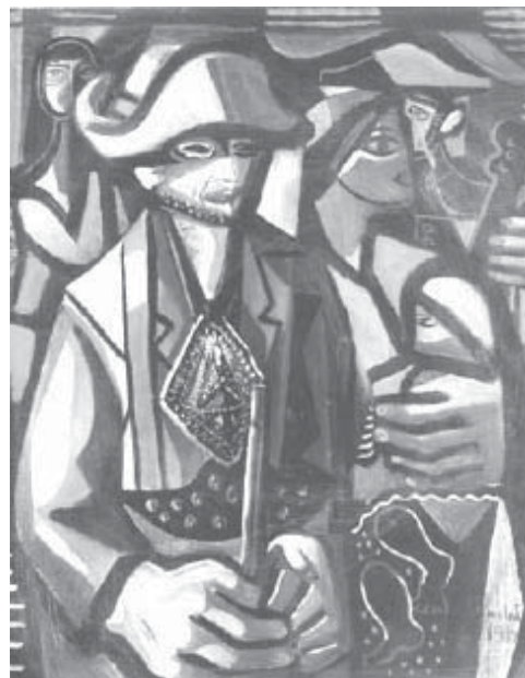
Cangaceiro, pintura de Di Cavalcanti, 1952 (Fonte: http://www.dicavalcanti.com.br ).

Apesar de em diversos momentos e lugares ter enfrentado as tropas do Exército, o principal inimigo da Coluna foi a tropa do latifúndio, inclusive por terem convocado o bando de Lampião, o cangaceiro mais famoso do Nordeste naquele período, para enfrentá-la. Uma das principais características da jagunçada era a crueldade e a violência com os participantes da Coluna Prestes e seus parentes. Além de torturas, o assassinato de presos era comum.