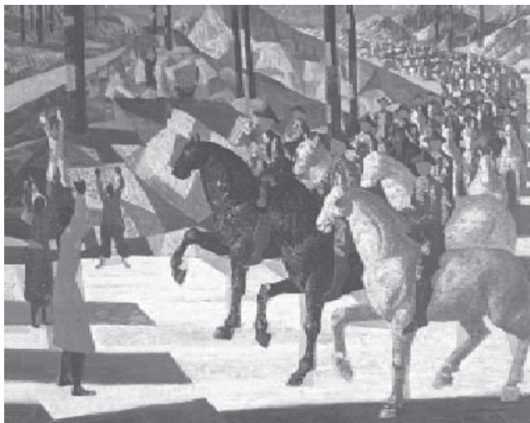
Coluna Prestes, Pintura a óleo/tela de Cândido Portinari, Paris, 1950 (Fonte: http://www.portinari.org.br/IMGS/jpgobras/OAa_1543.JPG ).

Para dialogar com o filme sobre a Coluna Prestes, Avante Camaradas (1986), de Micheline Bondi, utilizamos duas obras que, com interpretações diversas, podem proporcionar ao estudante uma visão múltipla do episódio épico mais marcante do movimento tenentista. Apesar de as revoltas tenentistas remontarem ao levante do Forte de Copacabana em 1922 e às revoltas de julho de 1924, em São Paulo, Sergipe, Mato Grosso e Manaus, a escolha da Coluna Prestes para pensarmos o tenentismo se deve à possibilidade de ela ser considerada como síntese da rebelião tenentista na luta contra as oligarquias dominantes nos anos 1920. Suas reivindicações eram comuns às desavenças oligárquicas, girando em torno de temas como o voto secreto, justiça eleitoral, proibição de reeleição, educação pública obrigatória, moralidade política e administrativa, maior independência do Legislativo e Judiciário.