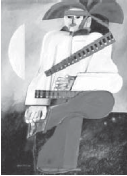
Cangaceiro, Aldemir Martins, 1977.