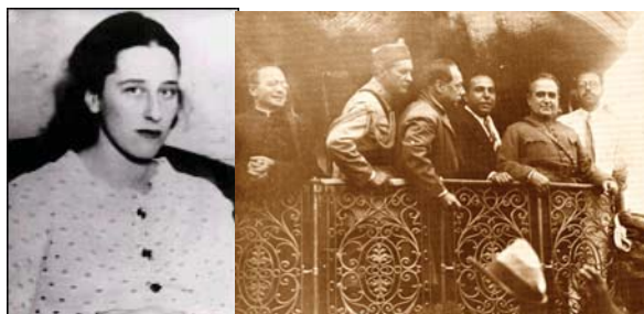
Olga Benário Prestes na prisão, 1936 e Getúlio Vargas em uniforme militar.

Podemos afirmar que a história e a imagem de Olga Benário será, de agora em diante, a que o filme construiu, pois esta biografia nos comove e mobiliza. Contudo, o filme não ousa enfrentar o mito de Vargas, responsável pelo martírio de Olga, que naquele momento simpatizava com o ideário autoritário do nazi-fascismo, talvez porque seu mito ainda estrutura determinada memória de setores expressivos da esquerda brasileira, principalmente ao ser lembrado como nacionalista e defensor dos direitos trabalhistas, como poderemos ver na próxima aula.