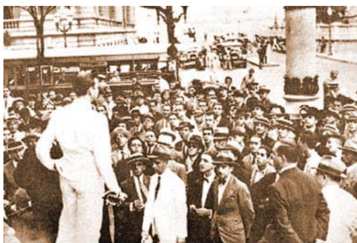
Comício da Aliança Nacional Libertadora. (Fonte: http://www.anovademocracia.com.br/pag1718.jpg ).

A aprovação da Lei de Segurança Nacional pelo Congresso Nacional, em 4 de abril de 1935 já indicava o fechamento do regime. Depois do fracasso do levante comunista de 1935 foram dadas as condições necessárias para a repressão dos setores oposicionistas ao governo, o que resultou na depuração da elite civil e militar proveniente de 1930, com a anuência do Congresso Nacional. Deste modo, parte expressiva dos aliados de 1930 foi-se afastando de Vargas, o que resultou numa ditadura assentada num discurso técnico-burocrático em que o exercício do poder prescindia do