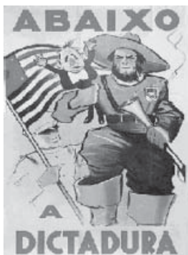
Cartaz da Revolução Constitucionalista, 1932. São Paulo (SP).

esquerda, com a formação dos movimentos integralista e da Aliança Nacional Libertadora (ANL). De um modo geral, essas tendências ideológicas expressavam “a exteriorização de inconformidades sociais, temor de proletarização e agravamento das condições de vida das camadas populares urbanas e dos pequenos proprietários rurais” (PESAVENTO, 1991, p. 45). Ao mesmo tempo, a intensa produção intelectual dos anos 1930 tinha em comum a inquietação, o ceticismo e o antiliberalismo, seja daqueles ligados à direita ou à esquerda. O conteúdo dessa inquietação pode ser percebido pelas transformações mundiais que punham em questão os esquemas tradicionais da política.