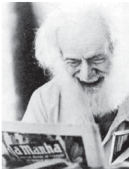
Aparício Torelly, o Barão de Itararé, e sua publicação A Manhã. (Fonte: http://www.lixosfera.com ).