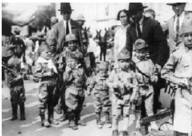
Revolução Constitucionalista de 1932. São Paulo (SP).

Como desdobramento da reconstitucionalização, podemos observar um processo de radicalização e polarização político-ideológica entre a direita e a