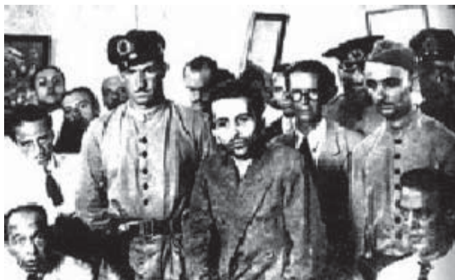
Prisão de Prestes em 1935.