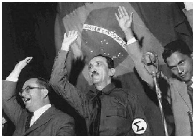
Ação Integralista Brasileira: Plínio Salgado e seus correligionários fazendo o anauê, saudação integralista.

intelectuais católicos traduziu, na sua produção literária, idéias como essência, sentido, vocação, mensagem, transcendência e drama presentes em obras como a de Otávio Faria, Lúcio Cardoso, Cornélio Pena, Jorge de Lima, Murilo Mendes, entre outros. O espiritualismo católico dos anos 1930 simpatizou, muitas vezes, com as soluções políticas de direita, e mesmo fascistas. Assim, devemos compreender o crescimento do movimento integralista