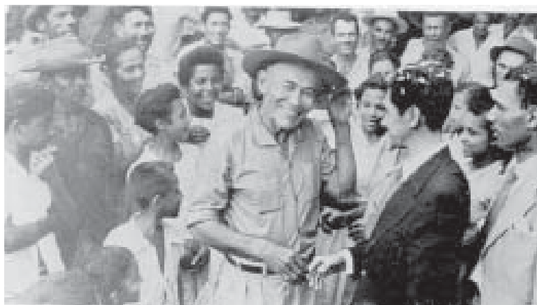
Francisco Julião, organizador das Ligas Camponesas, de terno escuro, com Zezé da Galiléia, um dos líderes do movimento. Pernambuco, 8 de outubro de 1959.

A construção da memória dos anos JK no filme, contudo, esquece de uma dimensão importante naquela conjuntura do final dos anos 1950: a emergência da ampliação dos conflitos fundiários e do crescimento dos movimentos sociais e políticos no campo, como as Ligas Camponesas no Nordeste e a crescente organização do sindicalismo rural em outras regiões do país.