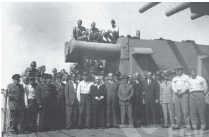
O Presidente Carlos Luz (9º da esq.), deposto pelo Movimento 11 de Novembro de 1955, refugia-se no Cruzador Tamandaré.

Como ressalta Ângela de Castro Gomes (1991, p. 2), a tradição política brasileira desde os anos 1930 assevera que presidente e ministro do Exército são figuras-chave “para a manutenção ou destruição das normas constitucionais vigentes”. Assim, a cúpula militar tornou-se a principal base de sustentação e estabilidade política do governo JK, ao mesmo tempo em que incorporou, com decisiva participação e articulação do general Lott, em postos governamentais um grande número de oficiais, tanto em ministérios, quanto nas empresas estatais como a PETROBRAS, a SUDENE e a SEAPE (Serviço Agropecuário). Isso acentuou e aumentou a autonomia e a eficácia dos aparelhos do Estado, em seu processo de superfortalecimento do Executivo, pois reduzia objetivamente o poder do Parlamento, como fica claro na criação de organismos paralelos na administração federal.