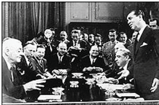
Encontro do presidente JK com Foster Dulles, secretário de Estado americano. Fotografia de Antônio Andrade (1958), à época fotógrafo do Jornal do Brasil. A imagem tornou-se símbolo do relacionamento político e econômico entre o Brasil de JK e os EUA (Fonte: images.google.com.br )

“Kubitschek inaugura a fase do ‘desenvolvimentismo’, último surto que a expansão capitalista logra realizar sob a cobertura do sistema populista. O novo impulso à industrialização estará uma vez mais vinculado a um aumento da participação do Estado – de forma direta e indireta – no aparato produtivo.