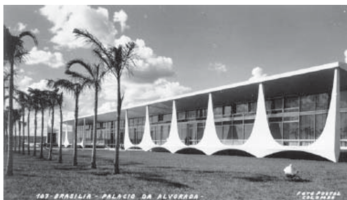
Cartão Postal do Palácio da Alvorada, 1960

Caro aluno, a imagem produzida para a posteridade do governo JK foi a de um estadista da estabilidade política, da anistia, e também o homem que trouxe a esperança de que o Brasil finalmente entraria na modernidade, com a construção da nova Capital, Brasília. Interessante observar que essa busca pela legitimação do discurso juscelinista atravessou a sociedade brasileira como um todo, atingindo detalhes do cotidiano da época da inauguração da nova Capital, como xícaras vendidas como souvenirs, que traziam consigo símbolos e inscrições do ideário desenvolvimentista e do mito do progresso. A eficácia ideológica desse discurso era exatamente apresentar-se enquanto desprovido de intenções. Souvenir, etimologicamente falando, é, em francês, lembrar-se, significando um movimento de “vir” de baixo: sou-venir, vir à tona o que estava submerso.