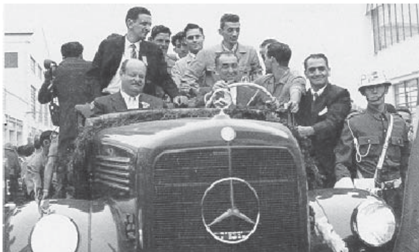
JK inaugura as novas instalações da fábrica de caminhões Mercedes Benz. São do Campo/SP, 28 de setembro de 19546. (Fonte: www.cpdoc.fgv.br ).