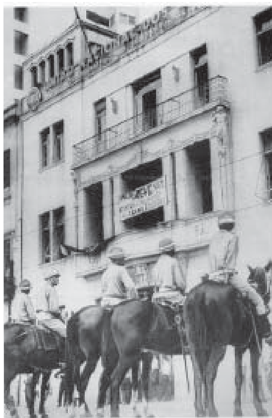
Policiais cercam o prédio da UNE durante protesto de estudantes contra o aumento das anuidades e a majoração das tarifas dos bondes. Rio de Janeiro, 1956.