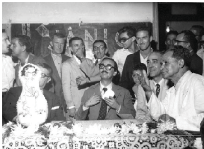
Movimento Popular Jânio Quadros. Sentados, da esquerda para a direita: Jânio Quadro (2º), Carlos Castilho Cabral (3º). Entre abril de 1959 e outubro de 1960