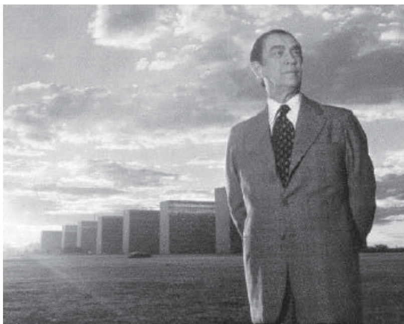
JK na Explanada dos Ministérios

A leitura solicitada no pré-requisito é muito importante para o andamento de nossa aula, tornando-a mais produtiva e facilitando a compreensão do conteúdo. Boa aula.