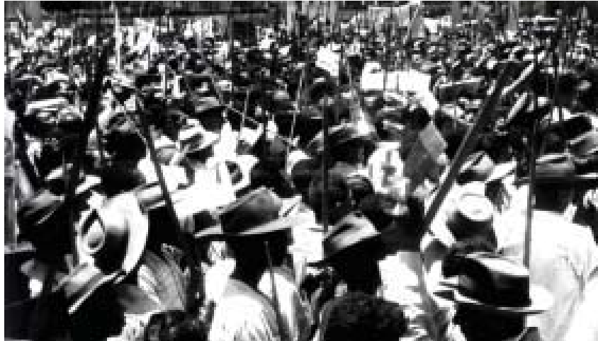
Concentração das Ligas Camponesas de Pernambuco. Setembro de 1960.

Como ressalta Vânia Losada MOREIRA (2003, p. 184-185), o programa de governo de JK apoiou, de uma forma muito efetiva, a expansão do modelo oligárquico territorial. Quando da construção de Brasília e do imenso cruzero rodoviário, JK não disciplinou a ocupação, posse e formação de propriedades rurais nas frentes de expansão, o que favoreceu o controle e o domínio da elite rural sobre os novos territórios ocupados. Ao mesmo tempo, essa medida prejudicou enormemente os posseiros, as populações ribeirinhas e povos indígenas, como foi o caso da expropriação de terras dos Kadiwéu (1959).