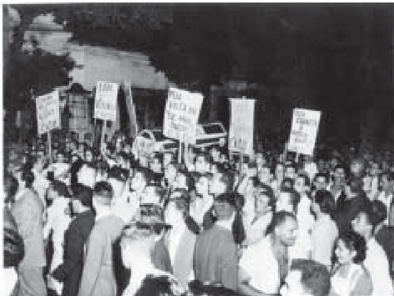
Estudantes contra o aumento das passagens de bondes. Rio de Janeiro, maio de 1956.