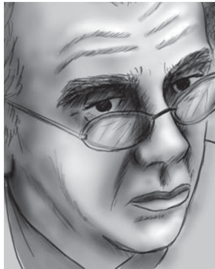
David Ausubel (1918/2008).