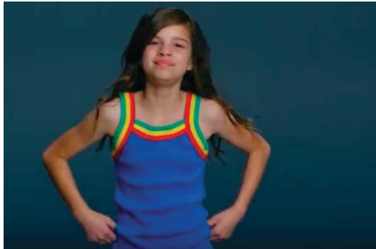
Captura de tela do Vídeo “ Like a Girl ”, propaganda da empresa Always .

A atividade apresentada sobre o vídeo Like a girl não estava presente no livro didático seguido pelo professor Y, tendo sido, dessa forma, preparada para atender às necessidades dos alunos e para promover um debate sobre uma temática identificada, pelo professor, como pertinente para a turma em questão. A preparação de materiais deve ser uma ação constante em nossas práticas docentes, estando respaldada em um processo de consolidação da autonomia do professor frente as suas turmas e aos livros indicados para adoção.