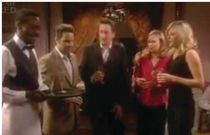
Captura de tela do vídeo “Social Phobia Treatment”.

A próxima atividade a ser analisada foi desenhada a partir de um vídeo produzido por um grupo de britânicos que possui um pequeno seriado disponível no Youtube. Trata-se da série de vídeos intitulada The Sketch Show . Neste episódio, algumas pessoas se reúnem em uma festa dedicada para aqueles que querem compartilhar as experiências de suas fobias. Acesse o site www.youtube.com e assista ao vídeo “Social Phobia Treatment”. Como sugestão, você pode acessar o link https://www.youtube.com .