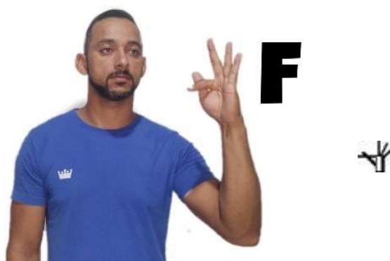
Figura 3 – Letra referente a CM [F] em escrita de Sinais.