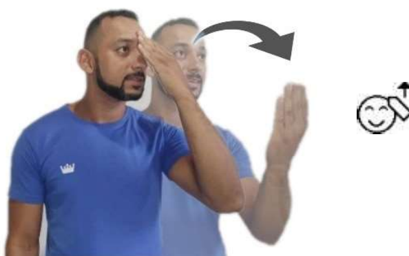
Figura 4 – Palavra OBRIGADO em escrita de Sinais.

Já neste outro exemplo vemos como é escrita do sinal de OBRIGADO/A.