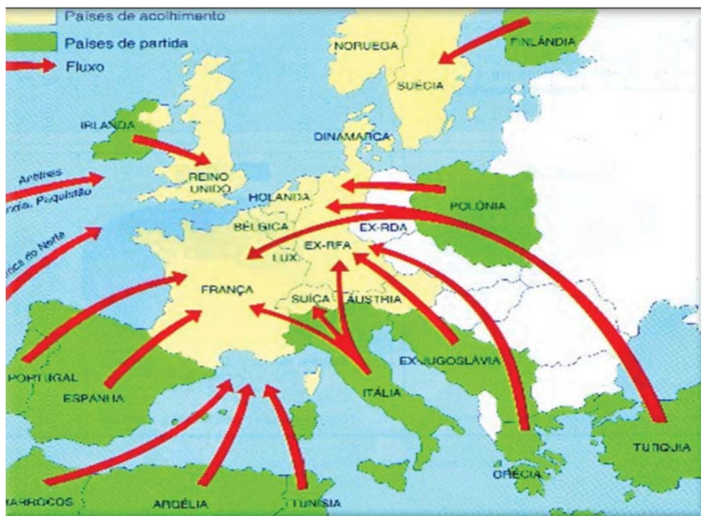
Figura: Movimentos migratórios para a Europa.

As causas ligadas ao referido fenômeno demográfico são, principalmente, a vontade pessoal de mudar o nível econômico-financeiro de vida e a fuga de perseguições ou discriminações por motivos religiosos ou políticos. Dependendo de onde surge o movimento a onda é mais ou menos intensa. Hoje, assistimos, a por melhores condições de vida, de populações do mundo subdesenvolvido (países periféricos) para o mundo desenvolvido (países centrais).