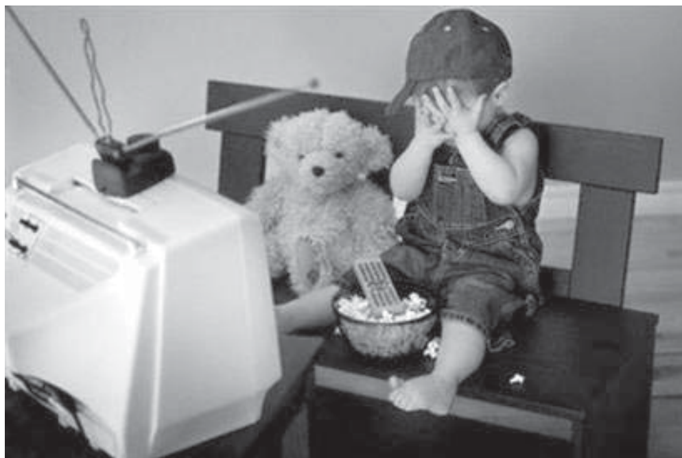
Criança influenciada pela televisão.