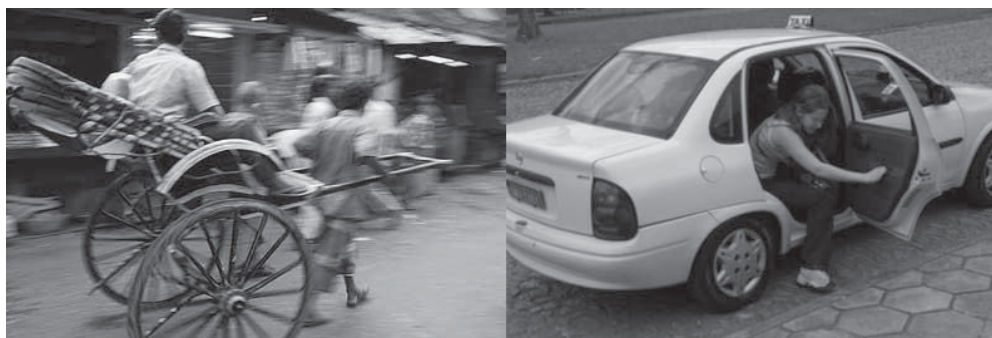
Riquexó e táxi.

Socialização é o nome dado a um conjunto de procedimentos que permitem que os indivíduos apreendam o modo de vida do seu grupo e passem a se comportar segundo as normas vigentes no seu meio social.