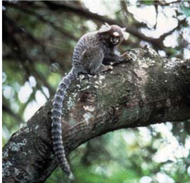
Callithrix jacchus

- Sub-diferenciação: quando um nome popular corresponde a mais de uma espécie de gêneros diferentes (ex: o nome arraia designa espécies correspondentes a 10 famílias de peixes cartilaginosos).