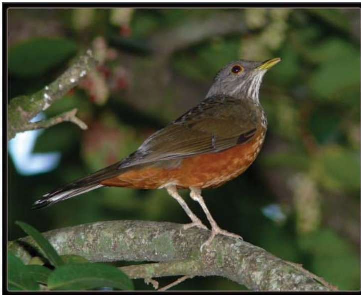
Sabiá-laranjeira ( Turdus rufiventris )

Na nomenclatura popular (ou folk ) existem os gêneros populares, e as espécies populares. Tal designação é feita em analogia ao sistema lineiano de classificação. SEIXAS & BEGOSSI (2001) definem um gênero popular como uma designação a um grupo de espécies que geralmente é composta por apenas uma palavra (ex: sabiá), enquanto espécie popular é uma designação mais detalhada que ressalta alguma característica morfológica ou comportamental, compondo um binômio ( sabiá-laranjeira , sabiá-poca ).