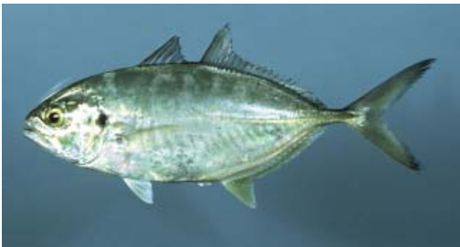
Caranx crysos

- Sobre-diferenciação: quando mais de um nome popular corresponde a uma mesma espécie, seja ela em fases de crescimento diferente (ex: Caranx crysos pode ser chamado de Manequinho, Carapau e Xerelete, dependendo da fase de crescimento), ou simplesmente por diversidade linguística (ex: Callithrix jacchus pode ser chamado de sagui, nico, mico, sauí, etc.)