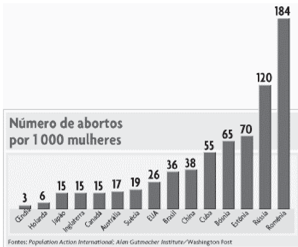
Abortos realizados, por país. Fonte: Instituto Alan Guttmacher.

Dados publicados pelo Instituto Alan Guttmacher ( www.guttmacher.org.br ), referentes à América Latina, apontam a existência de uma relação entre renda e acesso ao aborto praticado por médicos. Apenas 5% das mulheres pobres rurais têm acesso ao aborto médico, aumentando para 19% entre as mulheres pobres urbanas e para 79%, quando se trata de mulheres urbanas de renda superior. Para o ano de 1991, no Brasil, se estimou que o total de abortos induzidos foi de 1.443.350, constituindo uma taxa anual de 3,65 ocorrências para cada 100 mulheres de 15 a 49 anos, enquanto nos Estados Unidos, o número foi de 2,73. Também há que se considerar o número de óbitos causados em mulheres provocados por abortos clandestinos.