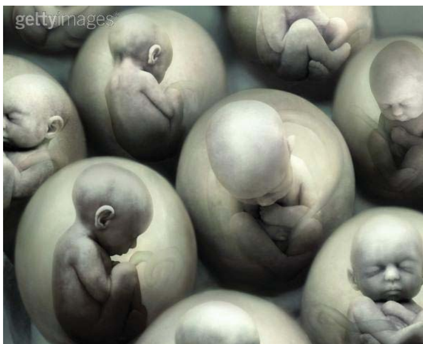
Há um direito ao aborto? (Fonte http://mensageirodapazluizbq ).

O aborto se encontra entre os temas mais abordados e debatidos em discussões públicas ou científicas, pois envolve questões morais, éticas, religiosas, políticas, econômicas, demográficas, de saúde pública, dentre outras. Entretanto, a intensidade das discussões não resultou em avanços sobre a questão, nem em consensos morais ou democráticos para o problema. Esta questão mostra como é difícil estabelecer um diálogo numa sociedade com valores morais tão diversos ou mesmo escrever um discurso acadêmico sem tomar partido algum sobre o tema.