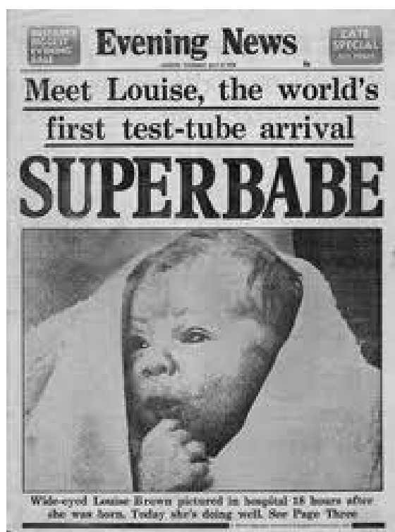
Louise Brown, primeira criança a nascer por reprodução assistida, em 1978.

Foi o primeiro bebê nascido a partir de fertilização in vitro, em junho de 1978, na Inglaterra. Sua gestação foi obtida após mais de dez anos de experimentos em embriões, realizados pela equipe dos Drs. R.G.Edwards e P.C. Steptoe. A publicação do fato ocorreu dois meses após o seu nascimento e a principal questão bioética levantada dizia respeito à confidencialidade e privacidade da família e, especialmente, da criança. Durante muitos anos a imprensa noticiou fatos sobre a sua vida.