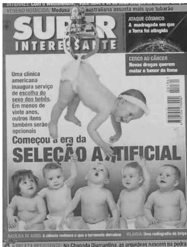
Escolha de Sexo. ( http://www.sebodomessias.com.br ).

As primeiras questões relacionadas à questão não abarcavam os aspectos reprodutivos e apareceram quando foram realizadas as primeiras correções cirúrgicas em crianças portadoras de genitália ambígua. Tais procedimentos, de forma habitual, realizados nas fases iniciais do desenvolvimento de um ser humano, implicavam na opção do sexo anatômico que os pacientes passariam a ter, cabendo tal escolha ao profissional de saúde, com ou sem conhecimento da família ou do paciente.