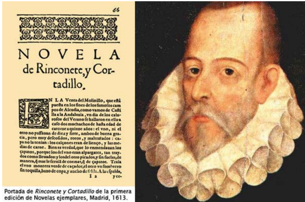
Novelas ejemplares de Miguel de Cervantes Fuente: ( http://www.librostube.org ).

El diseño de Cervantes era parejo al publicar la Primera parte del Quijote en 1605 y las Novelas ejemplares en 1613: presentar un abanico de ficciones que, por su pluralidad de enfoques y por su misma índole miscelánea, deleitando y aprovechando, propusieran la urdimbre continua de realidades y ensueños en que se trama la vida de los hombres.