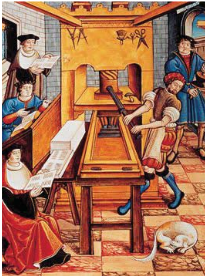
Imprenta alemana del renacimiento