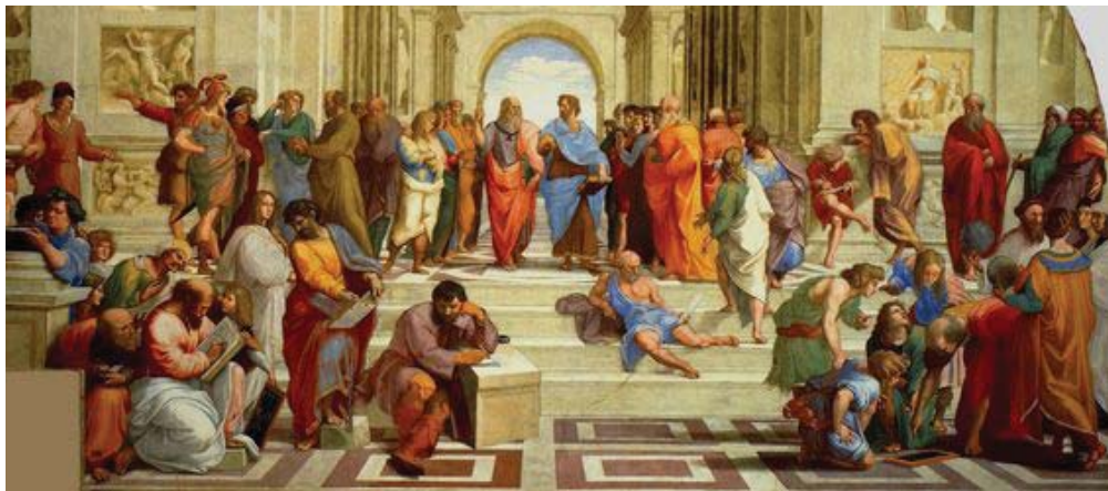
La escuela de Atenas, Rafael Sanzio Fuente: ( https://br.pinterest.com ).

El artista tomó conciencia de individuo con valor y personalidad propios, se vio atraído por el saber y comenzó a estudiar los modelos de la antigüedad clásica a la vez que investigaba nuevas técnicas (claroscuro en pintura, por ejemplo). Se desarrollan enormemente las formas de representar la perspectiva y el mundo natural con fidelidad; interesan especialmente en la anatomía humana y las técnicas de construcción arquitectónica. El paradigma de esta nueva actitud es Leonardo da Vinci, personalidad eminentemente renacentista, quien dominó distintas ramas del saber, pero del mismo modo Miguel Ángel Buonarroti, Rafael Sanzio, Sandro Botticelli y Bramante fueron artistas conmovidos por la imagen de la Antigüedad y preocupados por desarrollar nuevas técnicas escultóricas, pictóricas y arquitectónicas, así como por la música, la poesía y la nueva sensibilidad humanística. Todo esto formó parte del renacimiento en las artes en Italia.