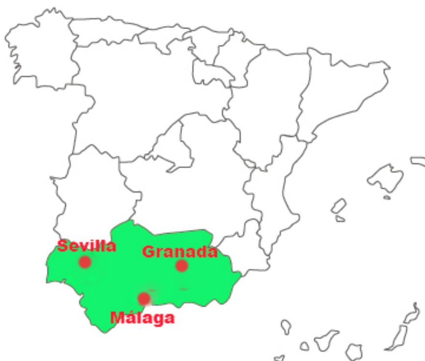
Área geolectal andaluza (en verde)

Lee los textos abajo para conocer un poco más de las capitales que sirven de modelo del área geolectal andaluza.