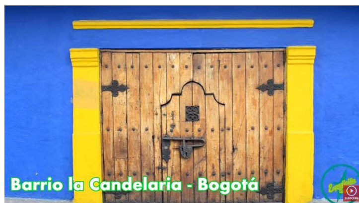
Bogotá. (Disponible en: https://www.youtube.com/watch?v=M-K5NlLnUDc )