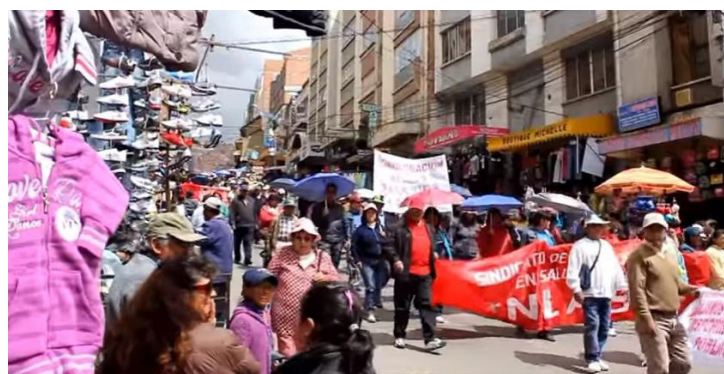
La Paz. (Disponible en: https://www.youtube.com/watch?v=jcSq1xr5-ho )