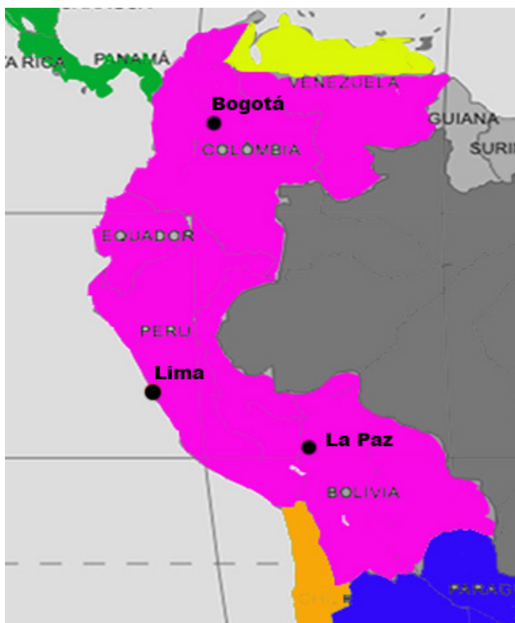
Área geolectal andina (en rosa)

Lee los textos abajo para conocer un poco más de las capitales que sirven de modelo del área geolectal andina.