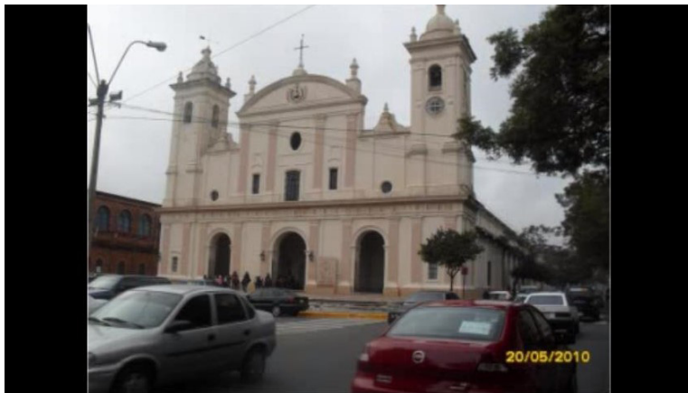
Caminando por Asunción. (Disponible en: https://www.youtube.com/watch?v=RHL9EuQzwSo )

Graba y envía para el AVA las respuestas de los cuestionamientos abajo: