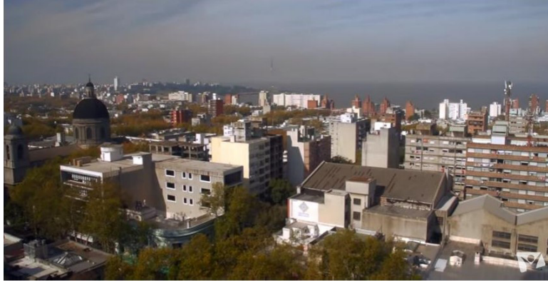
Montevideo. Disponible en: https://www.youtube.com/watch?v=wf-RF0hNdfo