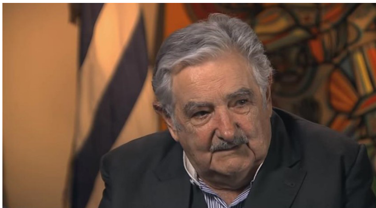
Modelo de Asunción. (Disponible en: https://www.youtube.com/watch?v=kvg1Y5Blybw )