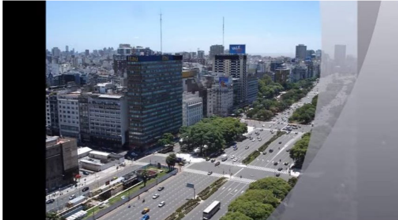
Modelo de Buenos Aires. (Disponible en: https://www.youtube.com/watch?v=zdbenkkqTtc )

¿Vamos a ver unos informantes de Buenos Aires, Asunción y Montevideo hablando? Haz atención al modo como hablan llevando en cuenta las características fónicas que viste en el apartado anterior.